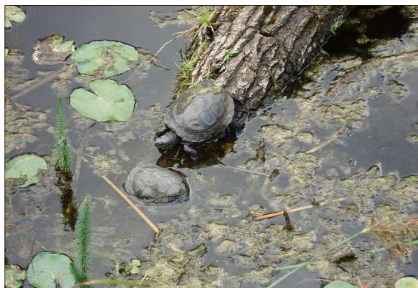
Tartarugas da palì vivan en lais e puzs, ma er sper flums ed uals.