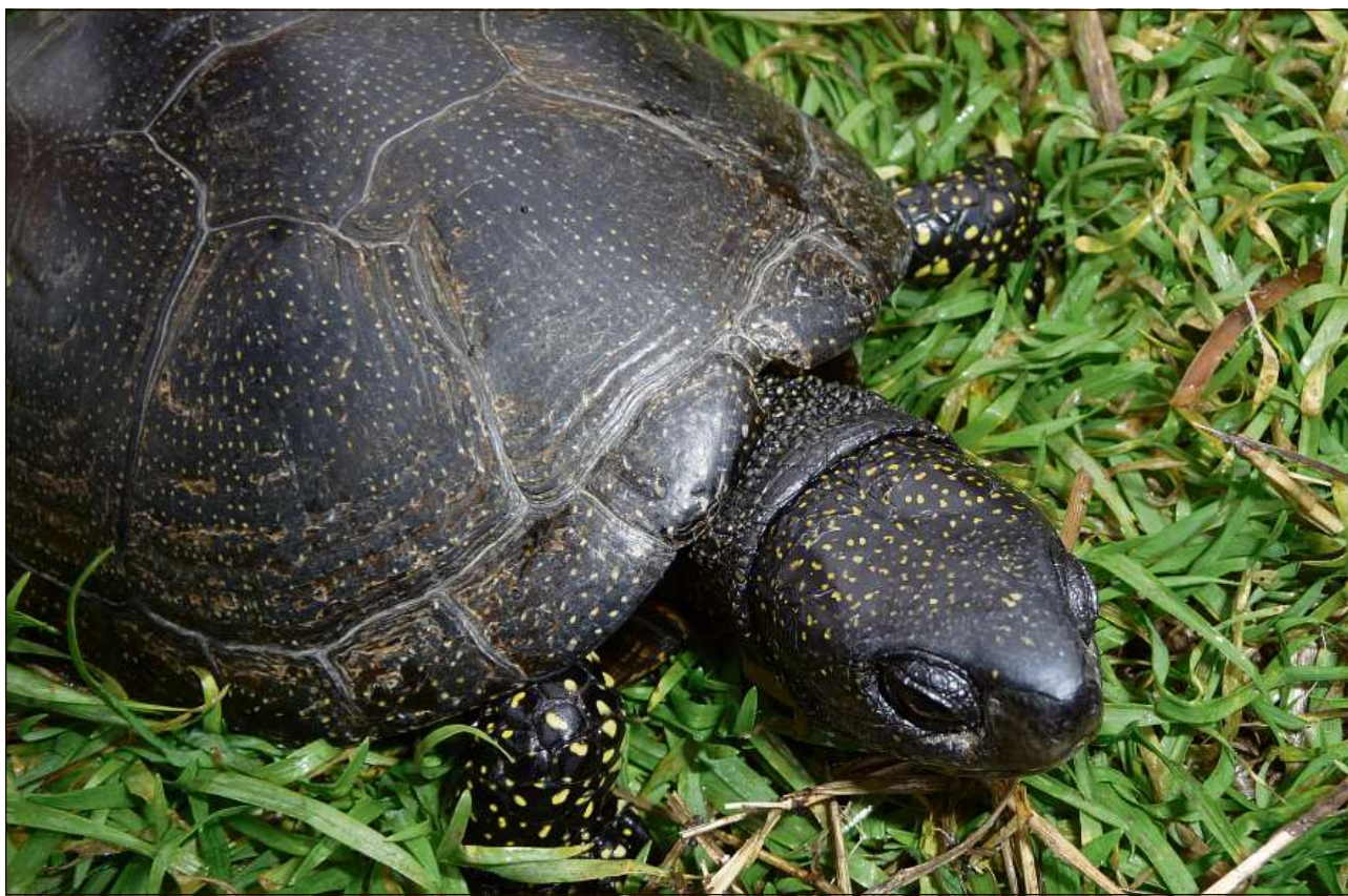
Ilis flatgs mellens èn caracteristics per animals creschids.

Il cuirass suren po esser grisch nair, brin u besch, cun radis u puncts mellens che van dal center da las plattas vers lur urs. Er il disseg variescha en sia colur, ma è per il solit pli cler che la colur da fund. Las colurs dal venter èn las medemas sco quellas dal dies: giagl e brin nair, en dis-