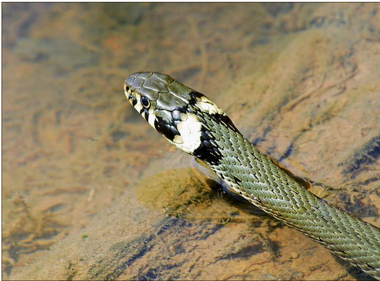
Zonas umidas sco la Weihermühle a Panaduz porschan impurtants lieus da retratga per insects, amfibis e reptils.