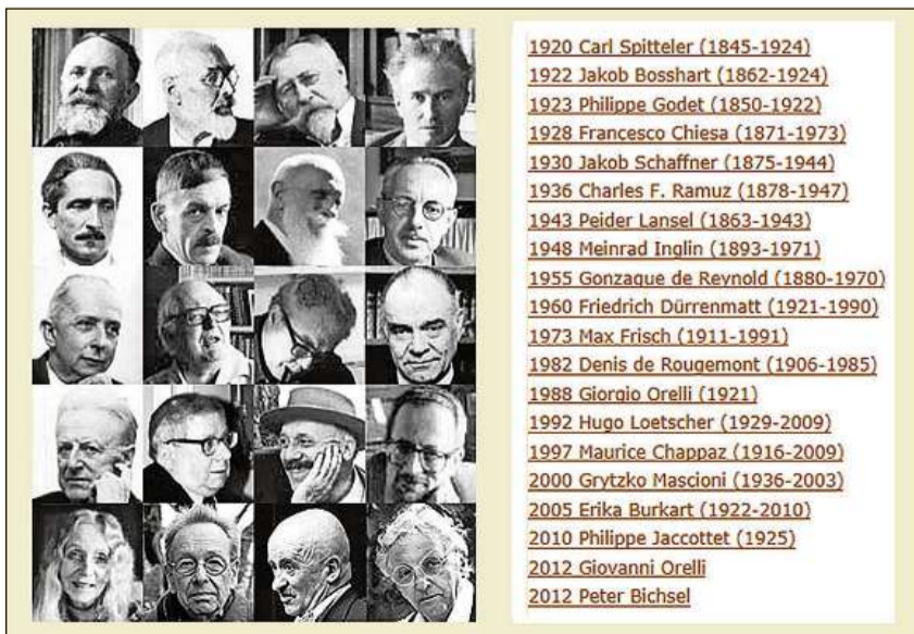
Premiada e premiads dal Grond Premi Schiller.