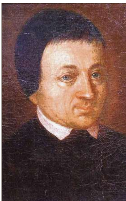
Pader Placi a Spescha.