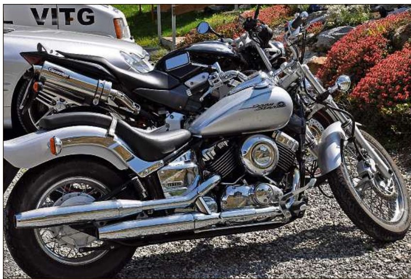
Harleys èn mainsvart da vesair avant il Rheingärtli. L'ustaria vegn frequentada savens da motociclists.

L'enviern ha Riedi adina lavurà sin il lift. Fin ch'il bab n'ha betg pli pudì per-