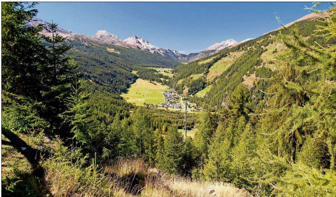
Val Müstair: sguard vers Valchava e Fuldera; davosvart il Pass dal Fuorn.