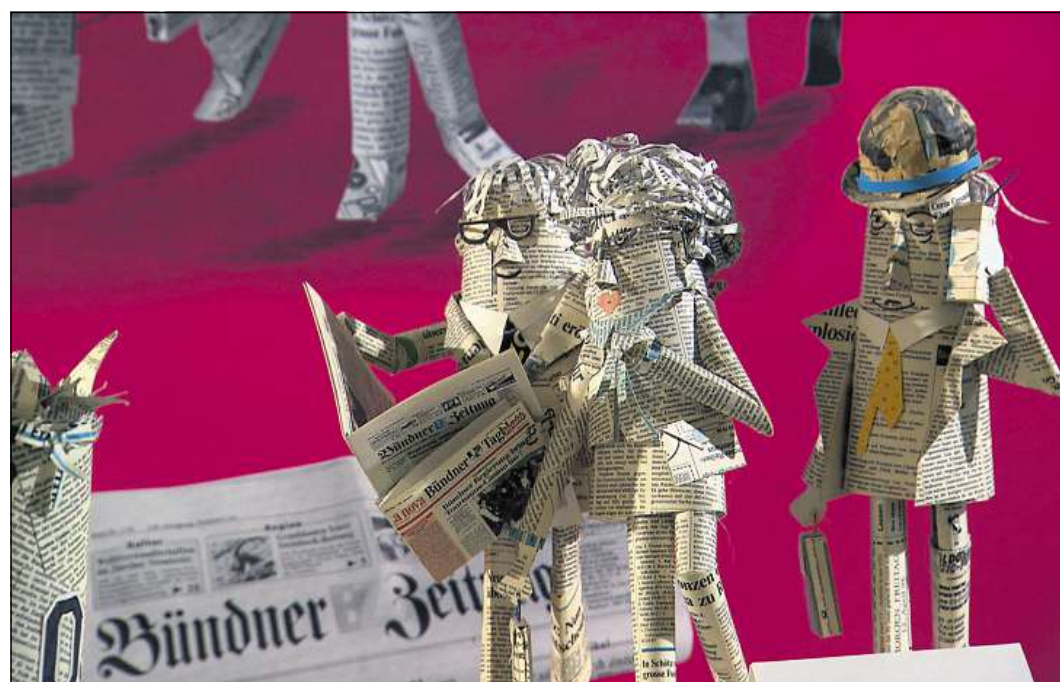
Publicitad per gasettas, 1996.