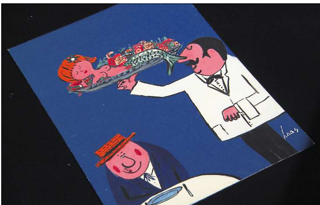
«Nebelspalter», 5 d'avust 1964, emprim frontispizi.