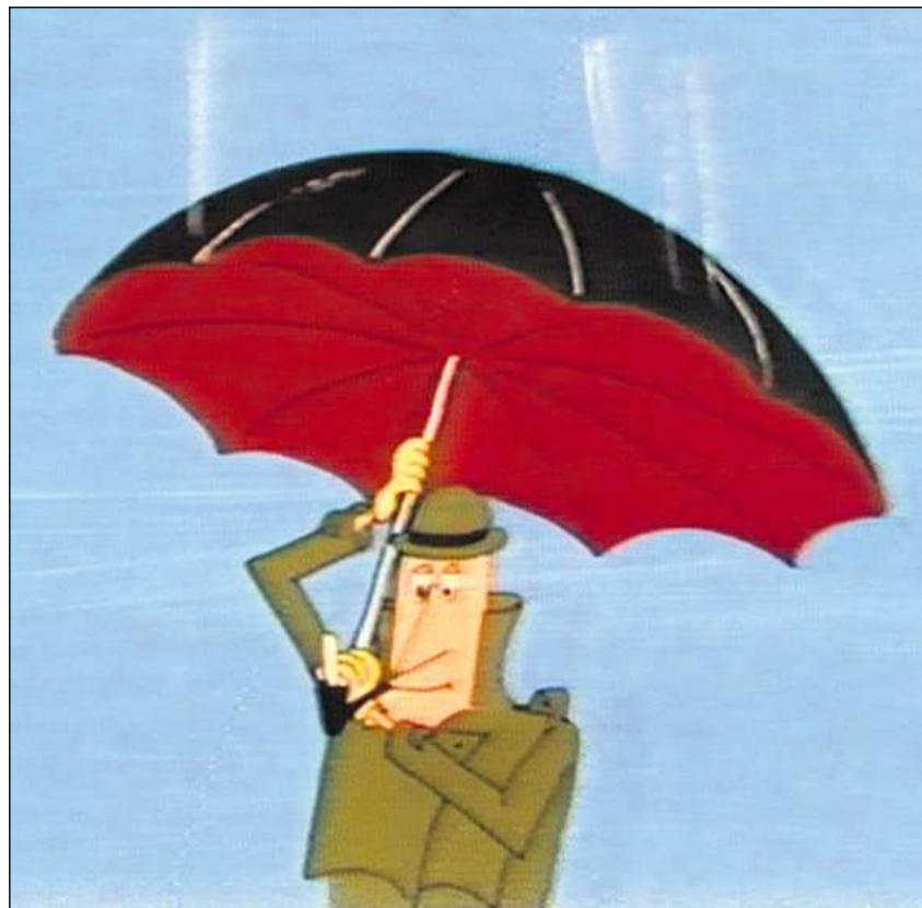
Zacharias Zack, film con disegni animati, 1980.