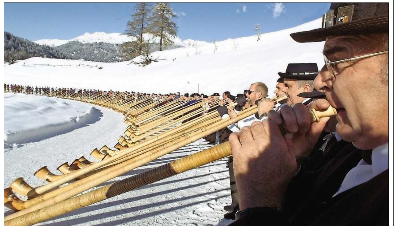
Tibas enstagl alumbards: En memoria a la battaglia da Marignano avant 500 onns ed en vista a l'avertura dal pli lung tunnel da viafier dal mund al Gottard prevedida per l'onn 2016 duain 500 tibas resunar a la Expo Milano 2015.

A Milaun èn planisads dus concerts da tiba cun trais premieras: la chanzun «Expo Milano» a las 11.00 en l'exposiziun sco tala, e sin la piazza dal dom a las 15.00 las melodias «Marignano» e «Gottardo 16». Tuts dus concerts cumenzan cun Rossini, ch'è cult en l'Italia, numnadamain cun la triada legendara da l'avertura da l'opera «Guglielm Tell». Questa triada dovan ils autos da posta svizzers dapi decennis sco signal acustic: «tü-ta-to». La triada dals diesch autos da posta a dus plauns che mainan ils 500 sunatibas a l'Expo vegn a restar en memoria als Milanais.