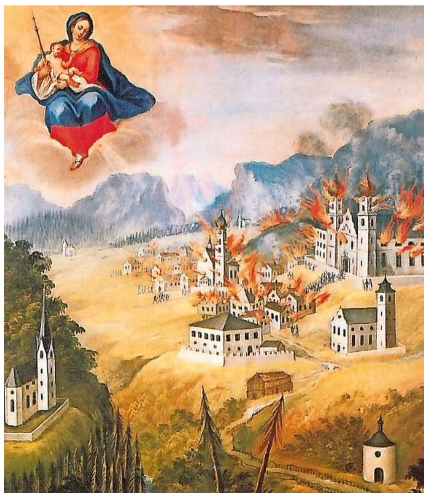
Suenter il sullevament dal matg 1799 han ils Franzos dà feu al vitg da Mustér.

Il LIR cumpiglia bundant 3100 artigels (geografics, tematics, artigels da familias e biografias) davart l'istorgia grischuna/retica e la Rumantschia. Editura: Fundaziun Lexicon Istoric Svizzer; versiun online: www.e-lir.ch ; versiun stampada: www.casanova.ch u en mintga libreria.