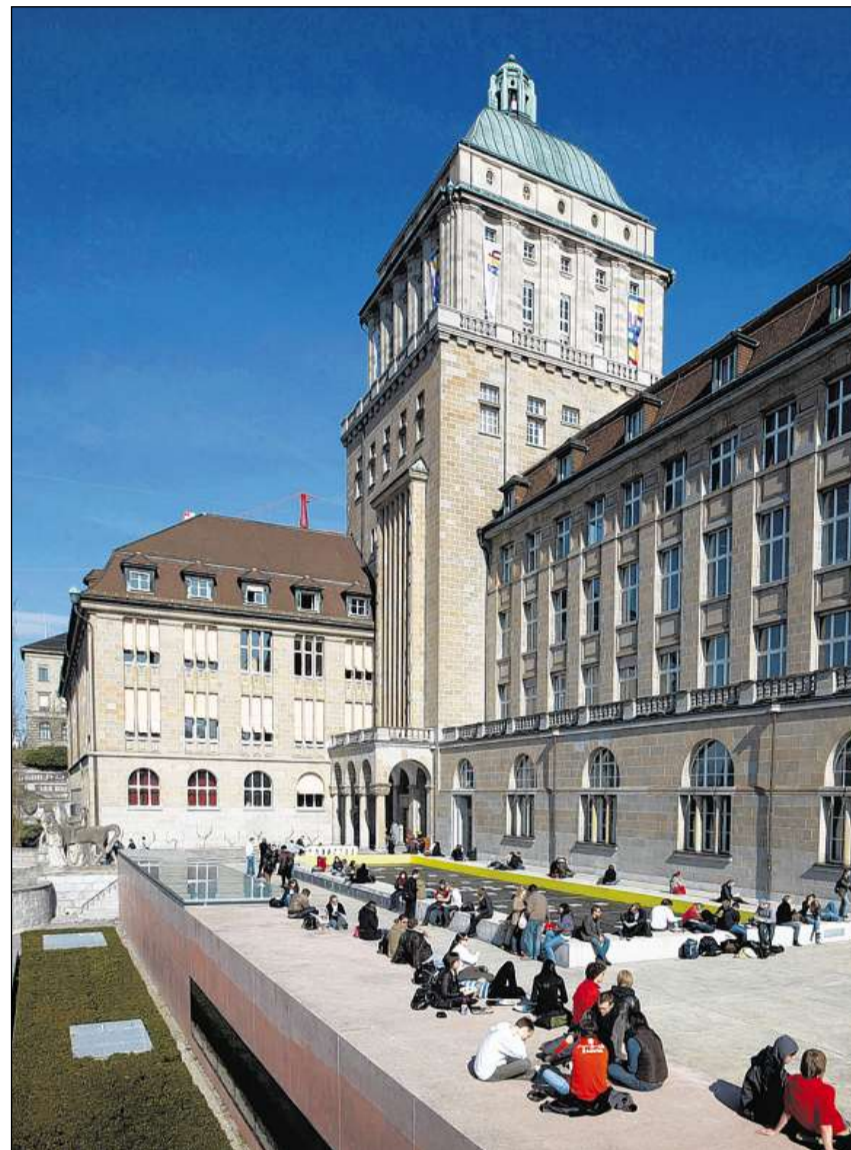
Edifizi principal da l'Universitad da Turitg.

Il Process da Bologna è in process complessiv per renovar la furmaziun da scola auta. Ses intent è quel da crear in spazi europeic da scola auta sco er da rinforzar la competitivitad da l'Europa sco lieu da furmaziun. La refurma è vegnida lantschada l'onn 1999 cun las suandantas finamiras: crear in sistem da certificats e da diploms bain chapibels e cumparegliabels, crear in sistem da studi da dus stgalims (bachelor/