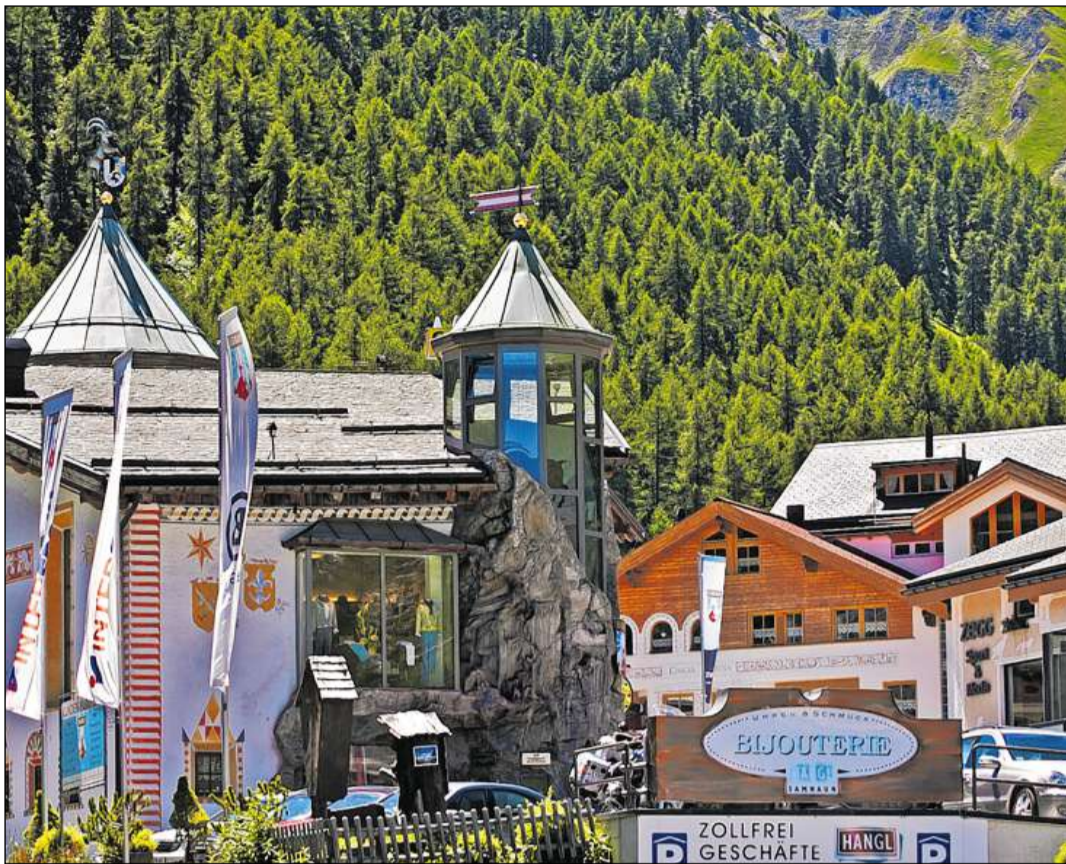
Dapi il 1970 profita Samignun d'in turissem da cumpra intensiv.