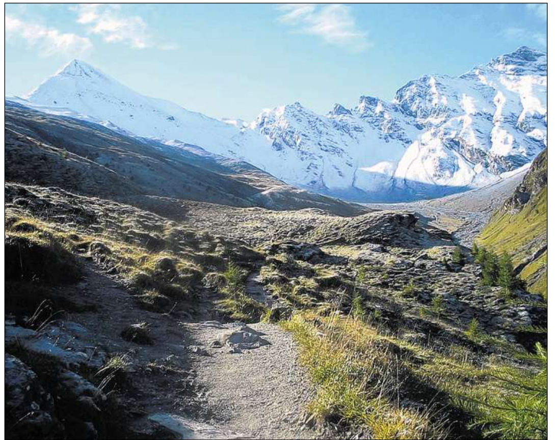
Il passadi dals colonisaturs: la Furclia Maisas situada tranter Muttler (a sanestra) e Piz Tschütta (a dretga). PD