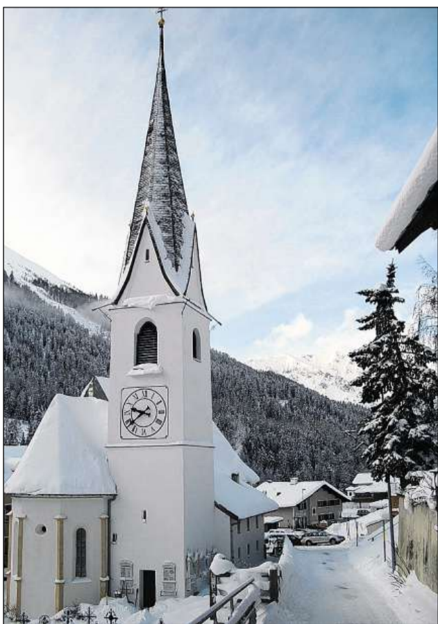
Baselgia da Son Giachen a Champatsch.

Vallada alpina en il Tirol, rumantsch Pazzanun (istoric). Il Paznaun s'estenda parallel a l'Engiadina Bassa da la Bielerhöhe (2021 m) vers il nordost e sbucca al vest da Landeck en il Stanzertal. En il temp autmedieval han cultivà e populà Rumantschs da l'Engiadina il Paznaun e sias vals lateralas dal sid. En il 11avel tschientaner possedeavan ils signurs de Tarasp alps en la Val Fenga. En il 12avel tschientaner ha glieud dals signurs de Tarasp e da la claustra da Mariamunt colonisà la part centrala da la val principala enturn Ischgl e Maton. Per il 13avel tschientaner èn attestads bains purils en la Val Fenga. Purs libers d'Ardez e da Sent èn sa domiciliads a Cuttūra, Paznaun e Sinsen. Il 1320 è ina gruppa da Gualsers, tributaris dal suveran dal Tirol, sa chasada a Cuttūra. La vischnanca, ch'ha pers 50 % da sia populaziun tras la pestilenza en ils onns 1348–51, appartegnava en il temp medieval ecclesiasticamain ad Ardez ed a l'uvestgieu da Cui-ra. Essend la via ad Ardez lunga e privlusa per turnar a laschar battegiar ils uffants e sepulir ils morts, han ils abitants dal Paz-