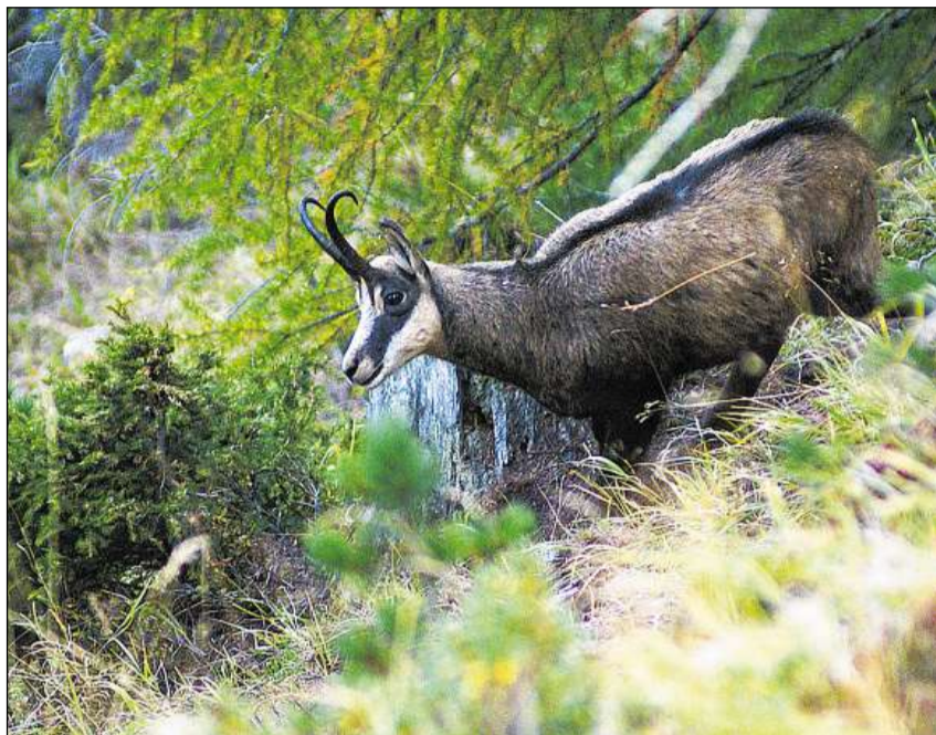
Chamutsch a l'ur d'in guaud muntagnard.

I n'è betg uschè simpel da differenziar tranter il buc e la chaura-chamutsch, omadus han cornas sumegliantas d'ina lunghezza da fin 25 cm. Quellas da la chaura èn pli satiglias e main stortas che quellas dal buc. Las cornas consistan, sco quai ch'il num exprima, da substanzas da corn, sumegliant a nossas unglas. Las cornas cre-