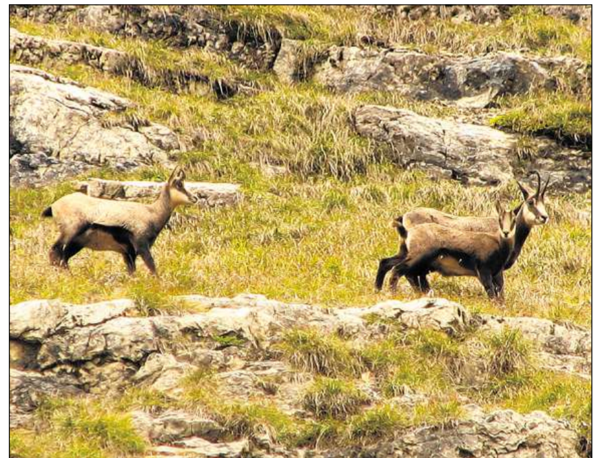
Gruppa da chamutschs en las Alps Tirolaisas.

L'atun ha lieu la midada dal pail mellen brin da stad al pail stgir d'enviern. Cun agid da quel è l'animal bain preparà per la stagiun freida. Cun quest vestgi pli stgir po