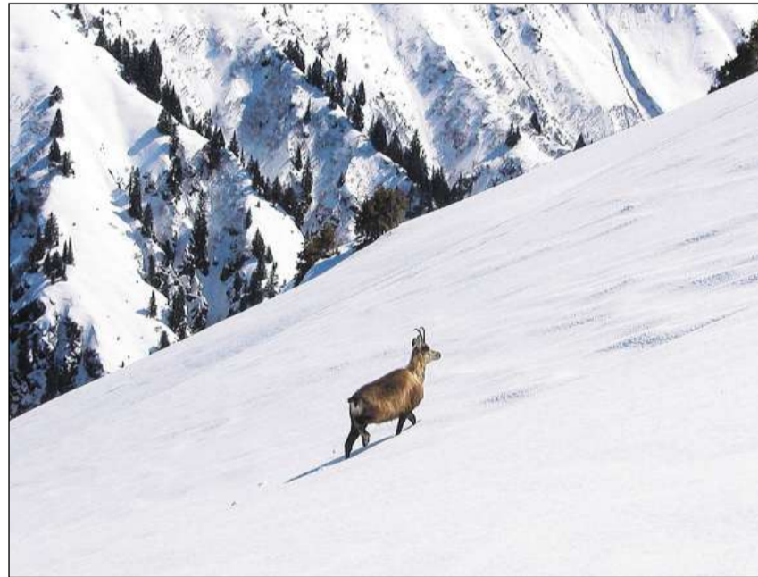
Il pail d'enviern è pli spess e pli stgir che quel da stad.

Ils ansiels-chamutsch naschan la fin matg u il zercladur e suonan gia suenter paucas uras lur mamma sur munts e vals. Durant l'emprima stad emprendan ils giuven ch-