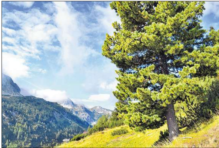
Tieu da muntogna en pe.