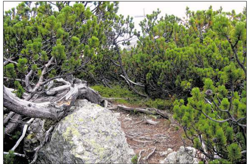
Tieu per terra u zunder.