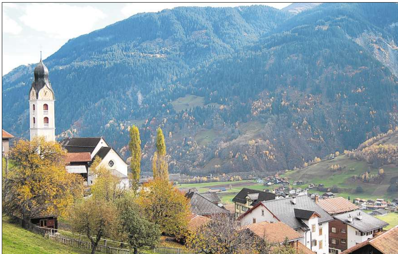
Sguard da Sumvitg vers Surrein a l'entrada da la Val Sumvitg.