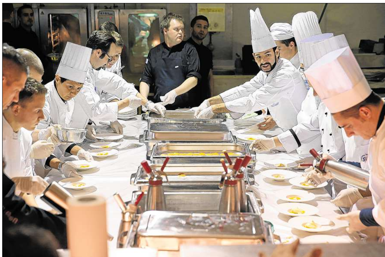
Cuschiniers en accziun durant il grond final sin il lai da San Murezzan.