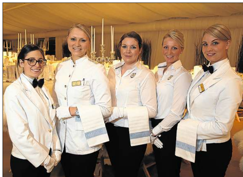
Tar in festival per mangiabains manca er betg il servis gentil.