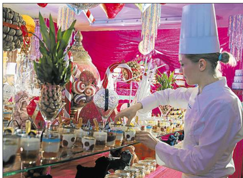
Be bunas chaussas er sin il buffet da dessert en l'Hotel Palace a San Murezzan.