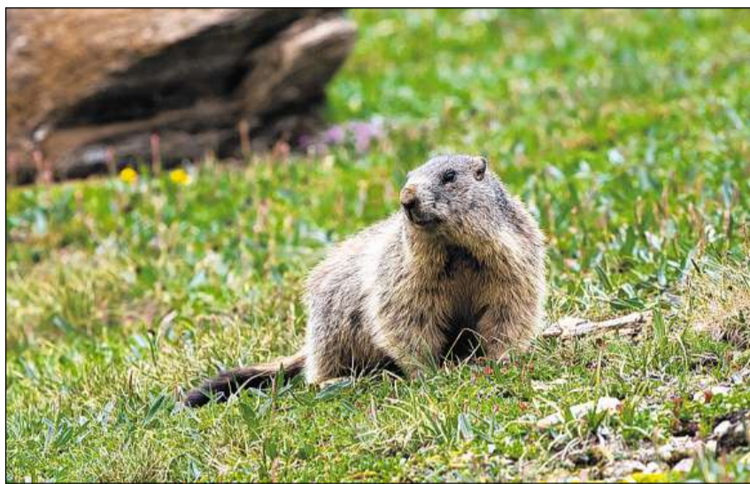
Las muntanellas vivan sin pastgiras d'alp e pastgets subalpins.

Caracteristic per las muntanellas èn d'ina vart ils lungs dents da ruiders, da l'autra vart la ferma musculatura da la spatla e