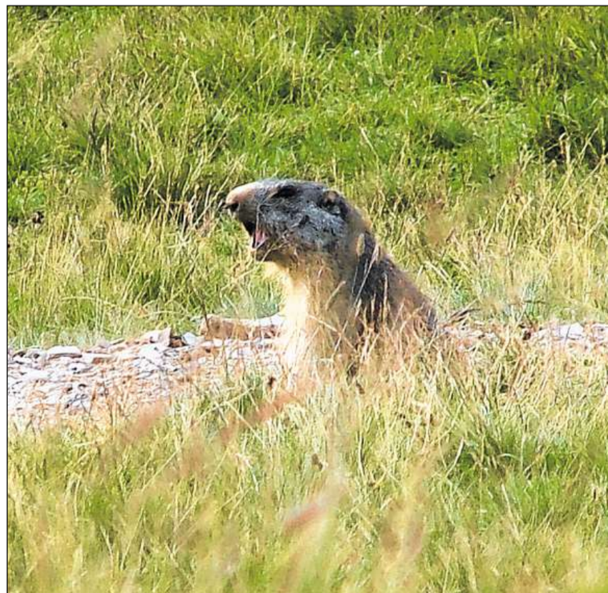
Cun lur tschivels averteschan muntanellas da privels.