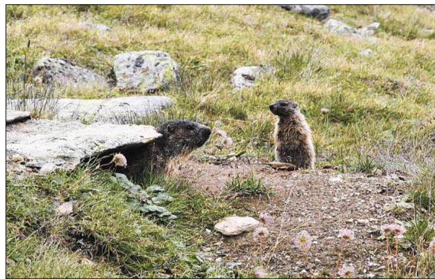
Animals giuvens passentan plirs onns en il ravugl da la famiglia.