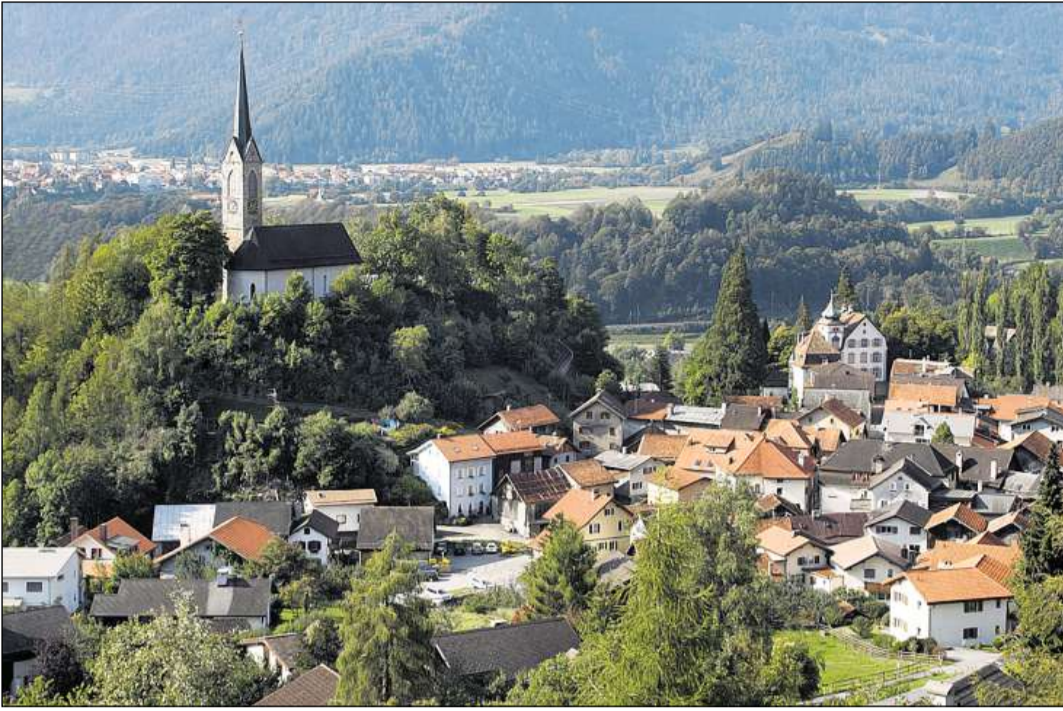
Tumein cun la baselgia reformada.