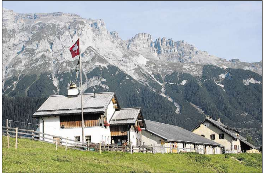
Sin il Pass dal Cunclas.