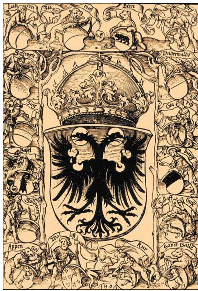
La Confederaziun cun ils Lieus alliads (1507).

Il LIR cumpiglia bundant 3100 arttgels (geografics, tematics, arttgels da famiglias e biografias) davart l'istorgia grischuna/retica e la Rumantschia. Editura: Fundaziun Lexicon Istoric Svizzer; versiun online: www.e-lir.ch ; versiun stampada: www.casanova.ch u en mintga libreria.