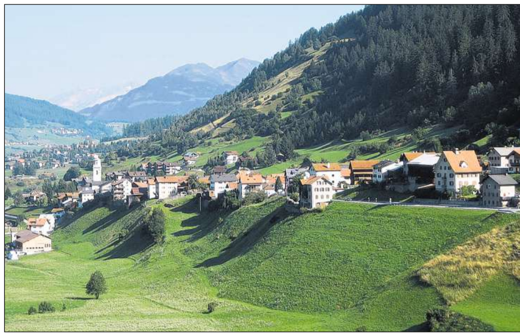
Il vitg da Tinizong s'extenda per lung da la via dal Güglia.