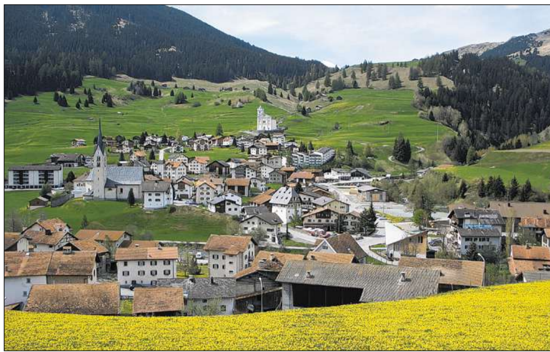
Savognin a sanestra da la Gelgia, cun las baselgias da Nossadonna e S. Martin.