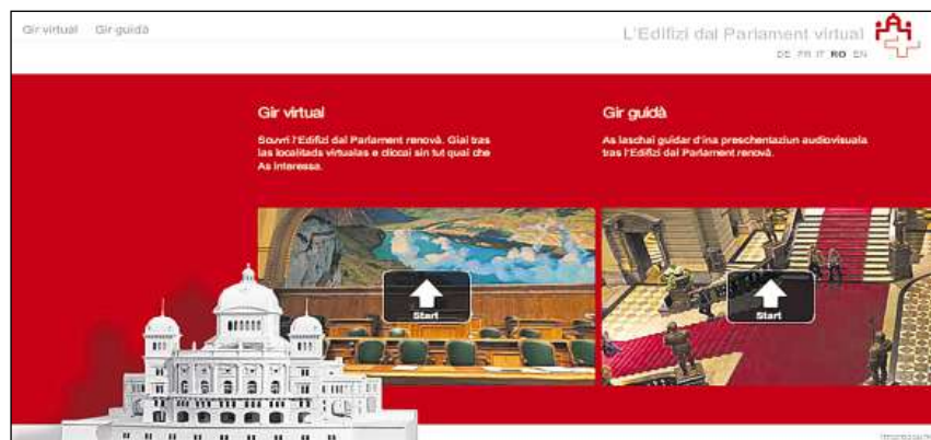
Il portal www.parlamentsgebäude-tour.ch porscha in gir virtual tras l'Edifizi dal Parlament en tuttas quatter linguas naziunales.

Dapli infurmaziuns: chatta.ch/?hiid=2663 www.chattà.ch