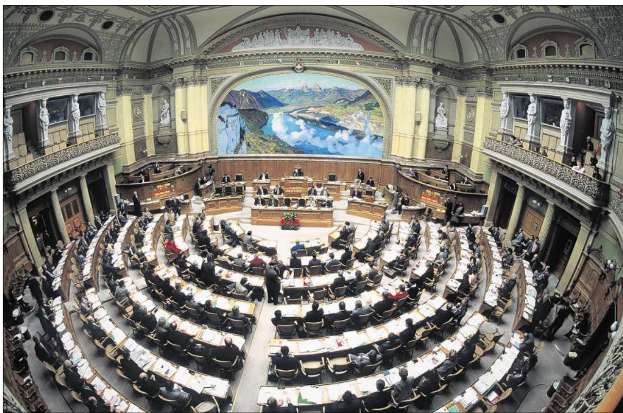
La sala gronda dal Parlament federal nua ch'il Cussegl nazional ha sias sedutas.

Davos il portal s'avra ina pitschna halla d'entrada vers las stgalas principals. Davant las duas pitgas che portan il tshiel sura da la halla d'entrada stattan dus urs da bronz. Sco simbols da la chapitala federala salidan els ils visitaders tegnend