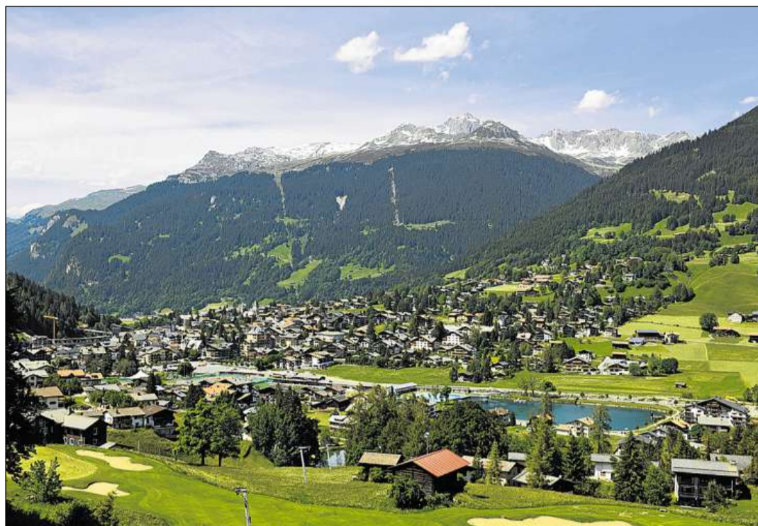
Clastra, in abitadi oriundamain sparpaglià, è oz segnà dal svilup turistic.