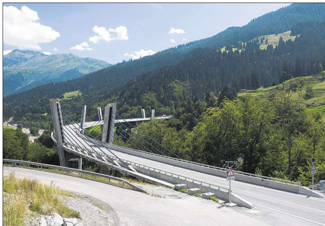
La Punt dal Sunniberg a Serneus (1998) è daventada la nova ensaina da la regiun.