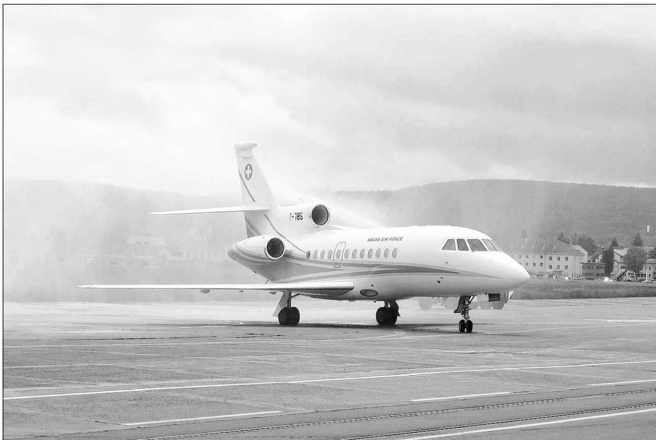
Il jet dal cussegl federal vegn adina sgulà d'in pilot da militar.