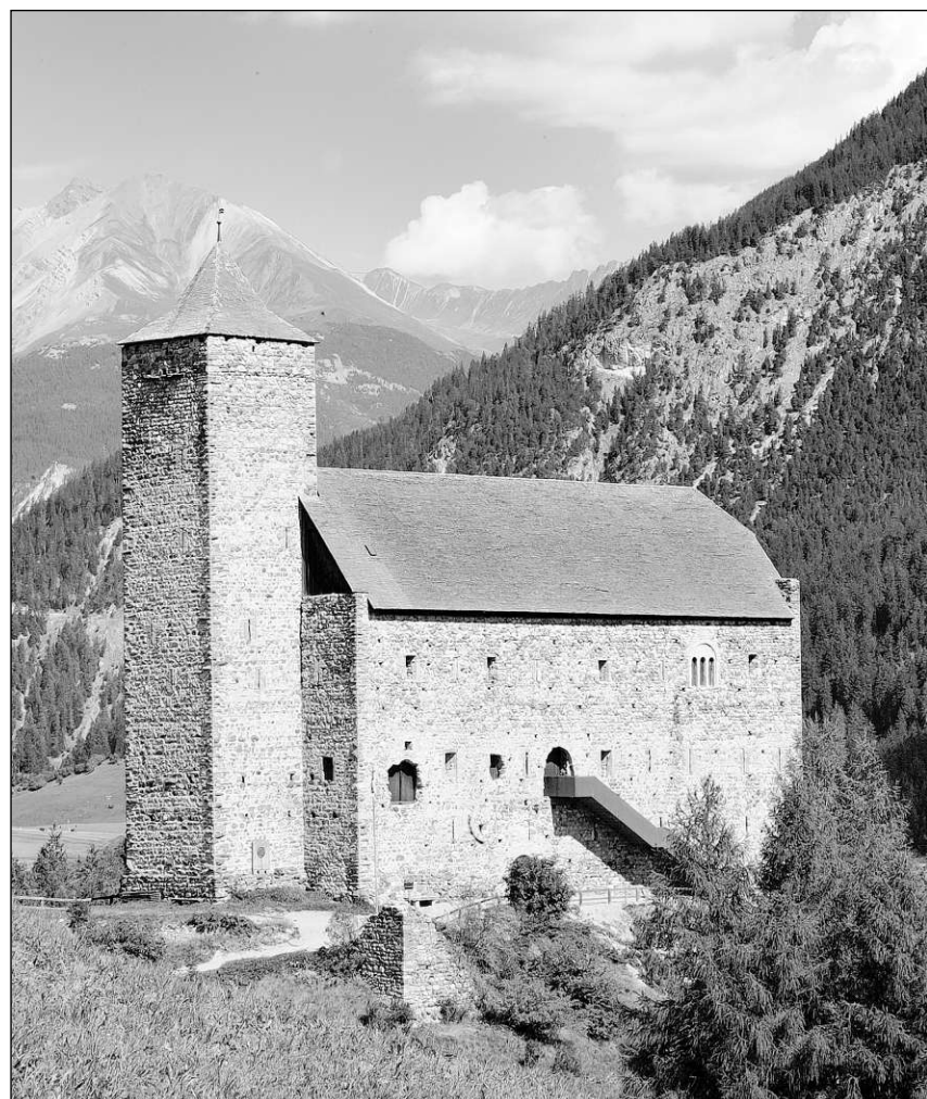
Dapi il 2006 vegnan dadas en il chastè da Riom produczions da l'«Origen Festival Cultural».