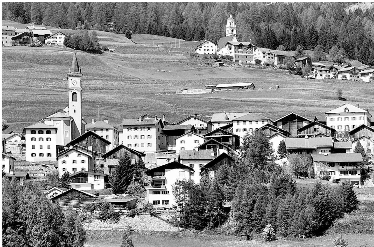
Ils vitgs da Riom e Paronz.

Vischnanca politica, circol Surses, district Alvra, situada a la via dal Güglia sin ina bova interglaziala a l'ost da la Gelgia, cun l'acclau da Burvagn e las acclas da Promastgel e Muntschect. 1370 Contra , tudestg Conters im Oberhalbstein (fin il 1943). 1850 182 abitants; 1900 152; 1950 152; 1970 116; 2000 212. Culegna dal temp da bronz (12avel tschientaner a.C.) a Caschligns sur Cunter, probablmain emprima colliaziun cun la Val d'Alvra. Part da la dretgira auta dal Surses entaifer la Lia da la Chadé fin il 1850; ils uffizis da quella dretgira eran savens occupads da members da la famiglia Scarpatetti, ina da las familias dominantas da la val. Ina baselgia è menziunada per l'emprima giada il 1392; la baselgia nova, construïda en stil baroc, è vegnida consecrada a s. Carlo Borromeo il 1677.