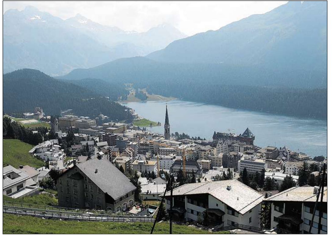
Vista actuala dal vitg da San Murezzan.