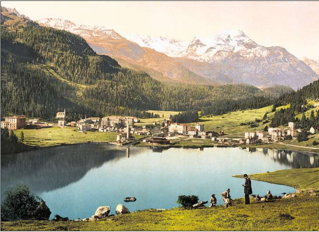
San Murezzan Bagn enturn il 1900.