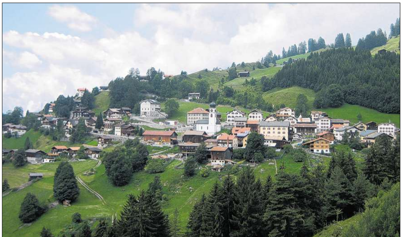
Peist furma il cunfin entadim da las anteriusas culegnas rumantschas en il Scanvetg.

Anteriur cumun e vischnanca politica, circul Scanvetg, district Plessur, situada a 1160 m sin la spunda sanestra dal Scanvetg d'Amez. 1137/39 sancto Petro . Fusiun cun Pagig a Son Peder-Pagig il 2008. A partir dal 2013 part da la vischnanca da vallada Arosa. Attestà sco vitg pir vers la fin dal temp medieval. 1808 197 abitants; 1850 108; 1900 115; 1950 161; 2000 154. La baselgia da vallada a Son Peder, menziunada per l'emprima giada l'onn 831, appartegniva ensemen cun la part dadora dal vitg (Laeschgas) a la claustra da Faveras che incassava qua las dieschmas da trais culegnas. L'urbanisaziun è stada pli u main terminada enturn il 1200. La ruina d'in chastè en vischinanza