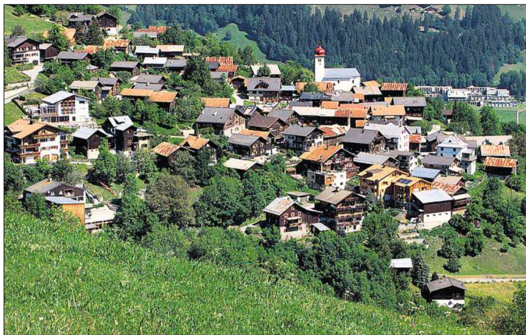
Il vitg da Luven giascha sin la spunda ost dal Piz Mundaun.