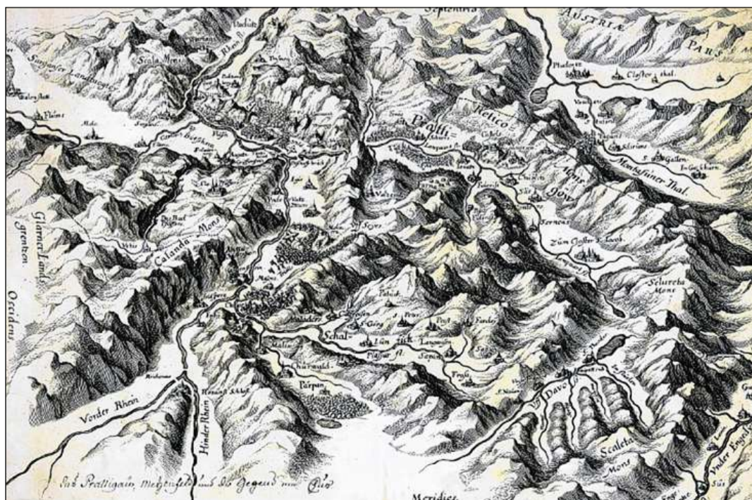
Charta panoramica da la regiun da Cuira (17avel tschientaner).

A l'entschatta dal 19avel tschientaner ha inizià la producziun uffiziala da chartas cun numerus ovras cartograficas chantunalas ad ina scala engronidida. Dal 1845–64 è vegnida realisada sut la direcziun dal Genevrin Guillaume-Henri Dufour la «Topographische Karte der Schweiz» cun 25 fecls (scala 1:100 000).