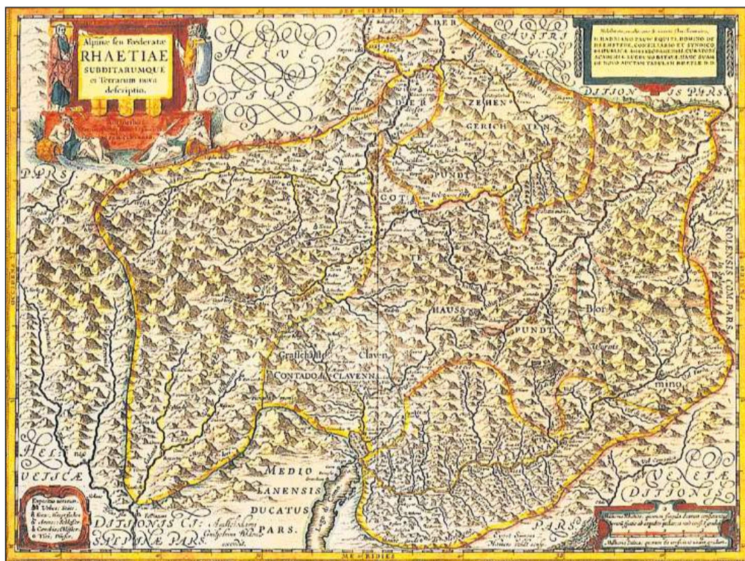
L'emprima representaziun topografica «moderna» dal Grischun (1618).