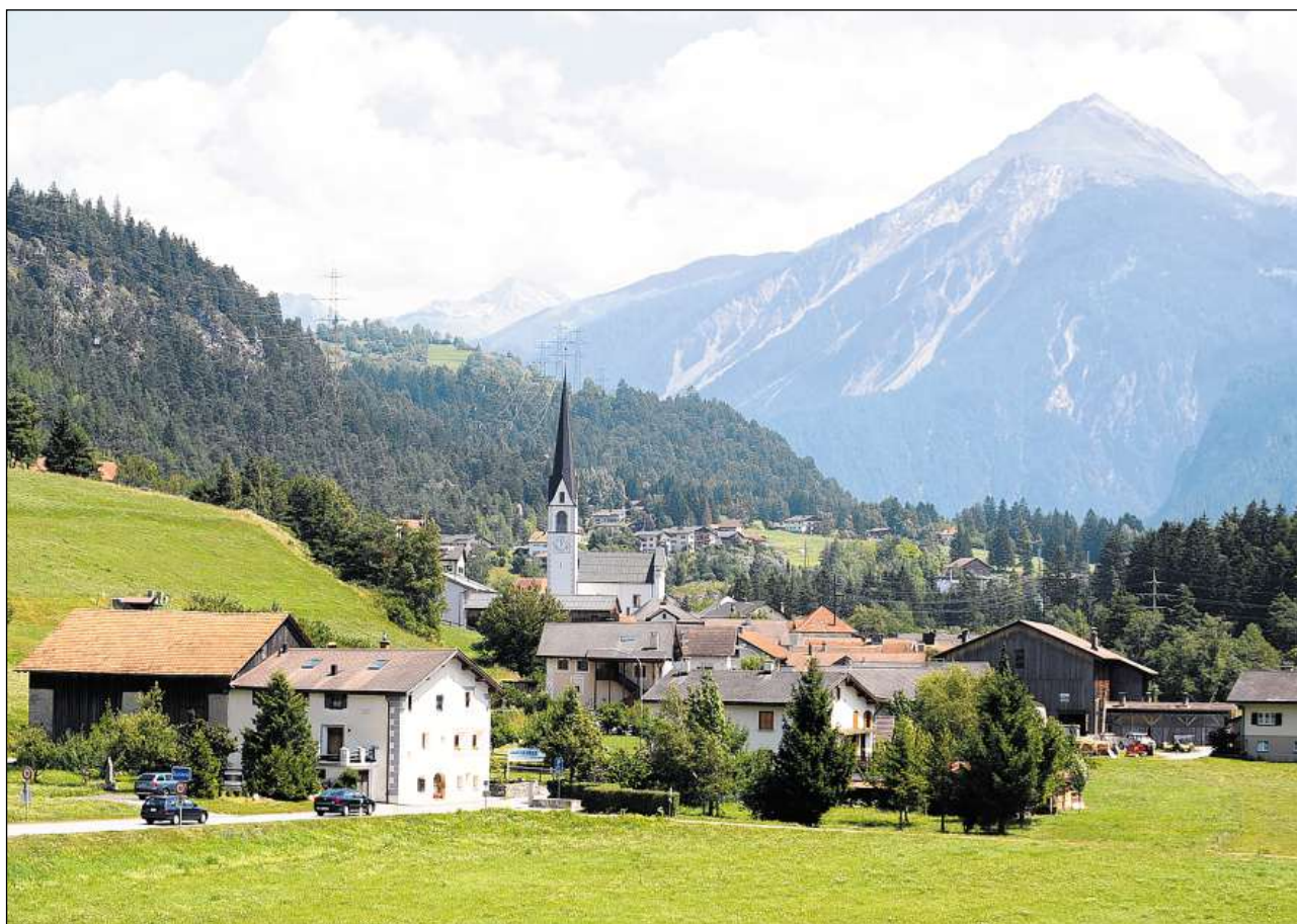
Surava en direcziun dal Muchetta, situà tranter l'Alvra e la Landwasser.