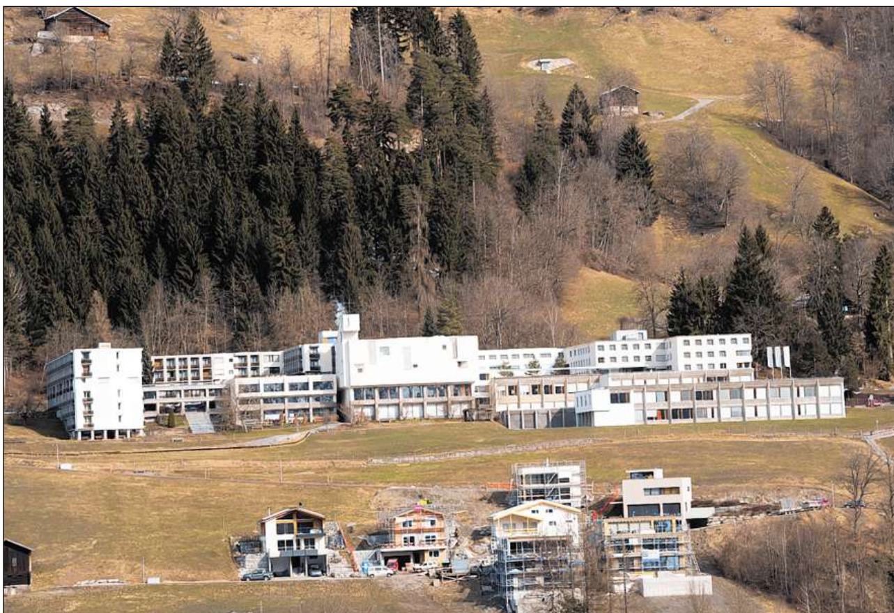
Il bajetg claustral a Glion (terminà il 1970) cun scola ed internat (1973).

Ils Artitgels da Glion dal 1526 avevan decretà in scumond da recepir novizas, provocond qua tras la dissoluziun dal convent da canonissas a Cazas (1570). Il 1647 è quel vegnì fundà da nov ed occupà da sis soras dominicanas da la claustra da Bludenz sin incitaziun da l'uestg Johann VI che vuleva crear (l'emprim sen-