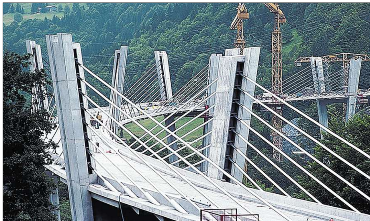
Christian Menn: Punt dal Sunniberg a Clastra-Serneus (1998).