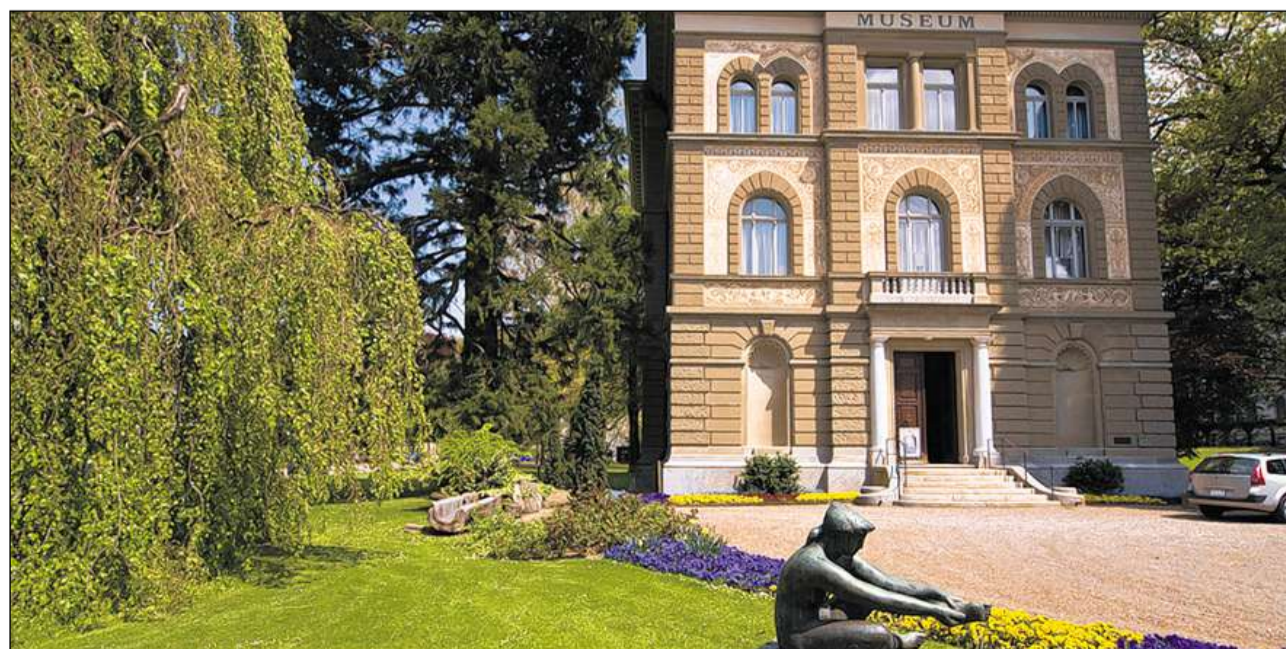
Il Museum da Zofingen.

chatta.ch/?id=1338&hiid=395 www.chattà.ch