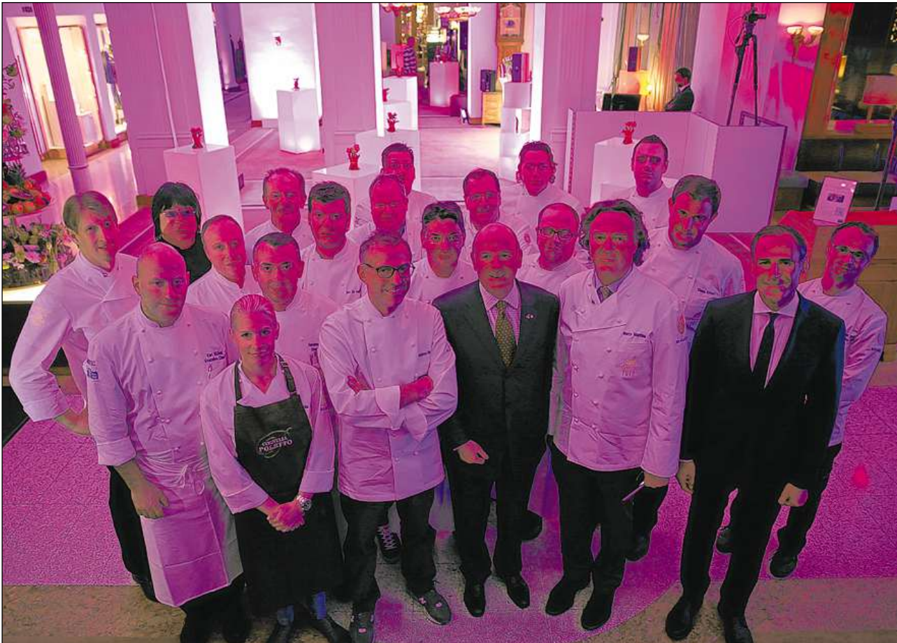
Il schefcuschiniers dals hotels da San Murezzan e conturn che sa participeschan a l'occurranza culinaria cun ils giasts cuschiniers dal 20. Gourmet Festival.