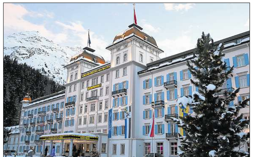
En l'hotel da luxus «Kempinski» a San Murezzan ha gi lieu la gronda party d'avertura dal festival da giubileum.

cuschinar pli fin e delicat è strusch pusaiel cun esser mintga piculezza servida ina delicatessa ed ina tratga exquisita. Almain ils mangiabains èn stads inchantads e blers han confermà che fin ussa saja quella party d'avertura, quai che pertutga la purschida culinara, stada il punct culminant en 20 onns. Insumma l'entir ambient è stà fitg festiv e glamurus en las localitads da l'hotel «Kempinski», cun ina atmosfera che tutga, sch'i vegn betg spargnà, per giudair spaisas finas ed exclusivas dals megliers cuschiniers dal mund. In ulteriur punct culminant dal festival da giubileum vegn ad esser l'uschenumnà «Gourmet Festival Village» nua che la zona da peduns a San Murezzan vegn transformada en ina via culinara e nua ch'ìls cuschiniers giuvens dals hotels da luxus da San Murezzan e conturn offreschan delicatessas culinaricas per mintgin. Quella occurrenza ha lieu damaun suenter mezdi a partir da las 16.00 e tranter las 17.00 e las 18.00 vegnan er ad esser preschents ils nov stars cuschiniers che derivan da set differents naziums.