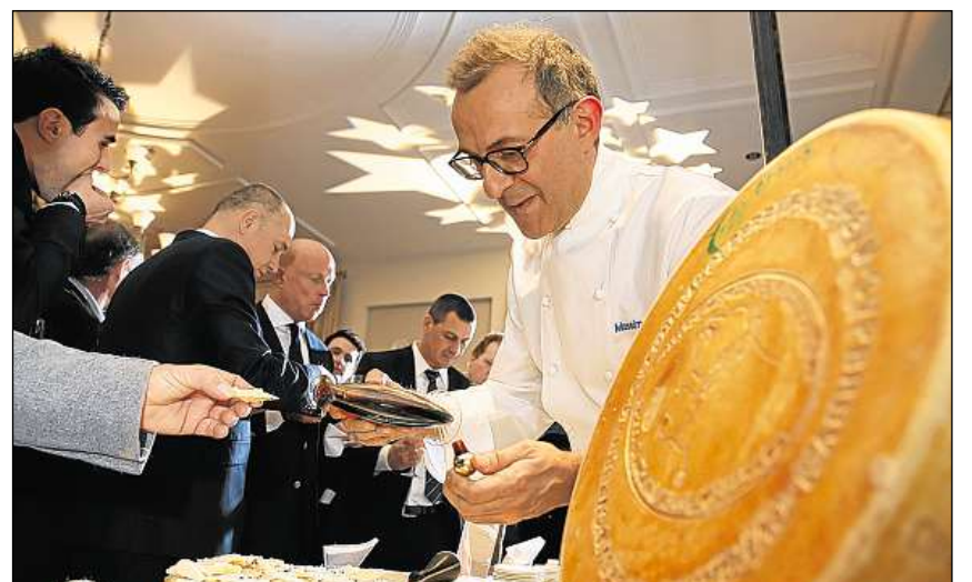
Massimo Bottura, da preschent il meglier cuschinier da l'Italia, ha servi «parmigiano» cun in «aceto balsamico» da 50 onns.