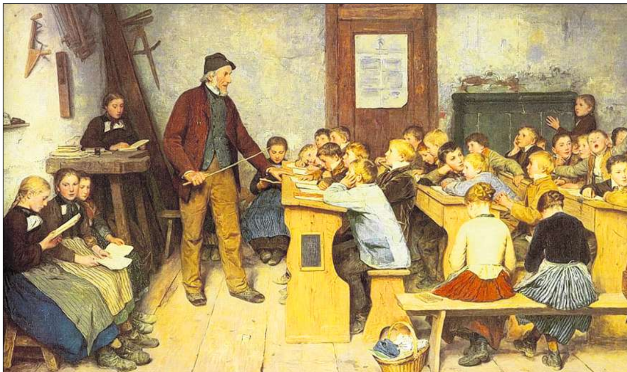
Scola dal vitg l'onn 1848 (Albert Anker 1896).

Quest ideal da la vita burgaisa era dentant resalvà ad ina pitschna minoritad da la populaziun. Mo en ina classa bainstanta da las citads pudevan las dunnas sa deditgar entirmain a lur pensums da chasa e desister d'ina lavur pajada. Il stil ideal da viver dals burgais valeva en il 19avel tschientaner per maximal il ventgavel da la populaziun – per l'elita politica ed economica dal pajais. Nagliur