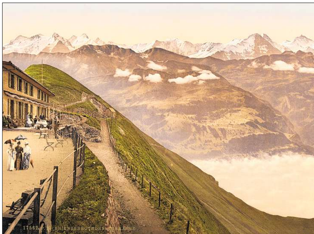
Il turissem prenda possess da las Alps (carta postale, ca. 1900).