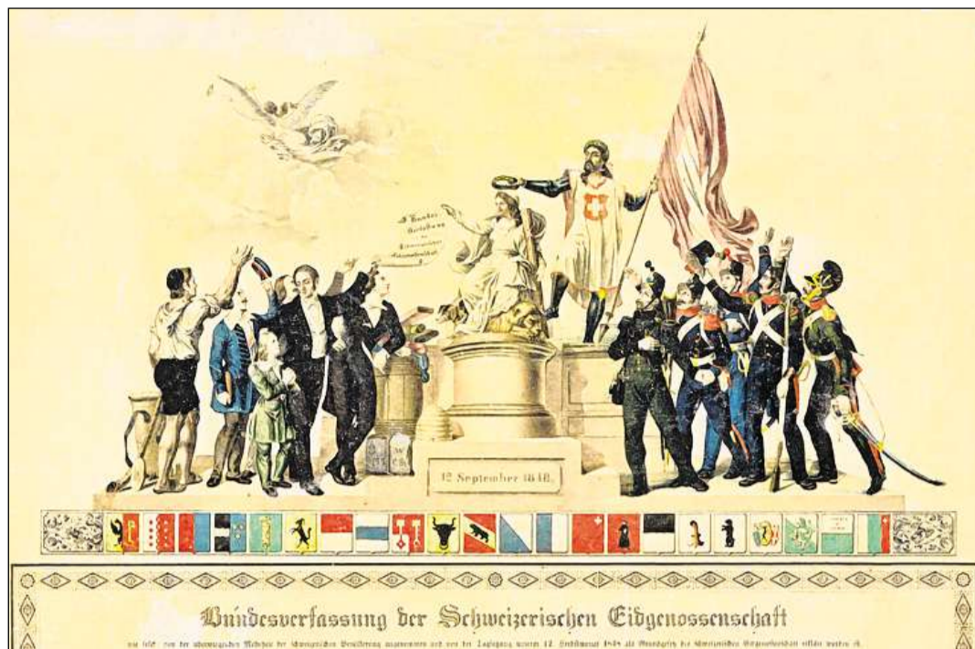
La nova Constituziun federala (carta commemorativa, 1848).