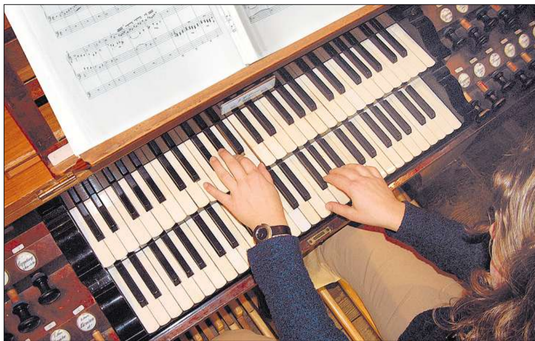
L'orgla – in element essenzial da la musica sacrala.