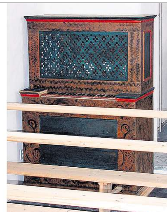
Las orglas da Zarcuns (a sanestra) e Silgin – instruments da Gion Flurin Coray.