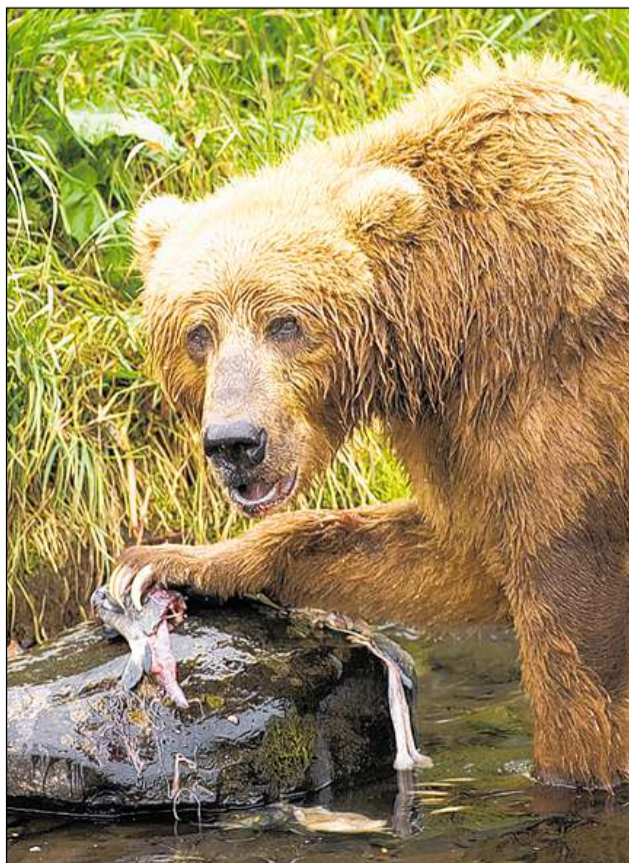
En l'America dal Nord èn ils urs brins baintant pli gronds ch'èn l'Europa.

L'urs da cuvel era l'urs il pli starmementus che ha vivi sin terra. Els avdants dals cuvels han fatg chatscha sin el ed al han venerà avant radund 40 000 onns. Dissegns en cuvels dal temp da crap, ch'ins chatta anc oz en Frantscha ed en Spagna, mussan quai. Cura che l'urs da cuvel è mort ora circa 10 000 onns avant Cristus, han ils umans cumenzà a venerar l'urs brin. Anc oz datti cults dad urs (veneraziuns solennas, rituals). Pievels da chatschaders dal nord sepuleschan l'ossa da l'urs, suenter ch'els al han mazzà e mangià sia charn. Uschia po l'urs puspè returnar sin il mund. L'urs è il dieu dal guaud e per intgins pievels schizunt il retg dals animals. En paraulas ed en il teater arriva el adina puspè tar nus sco «cumpar urs» – per il pli sco in gnuogn paschaivel.