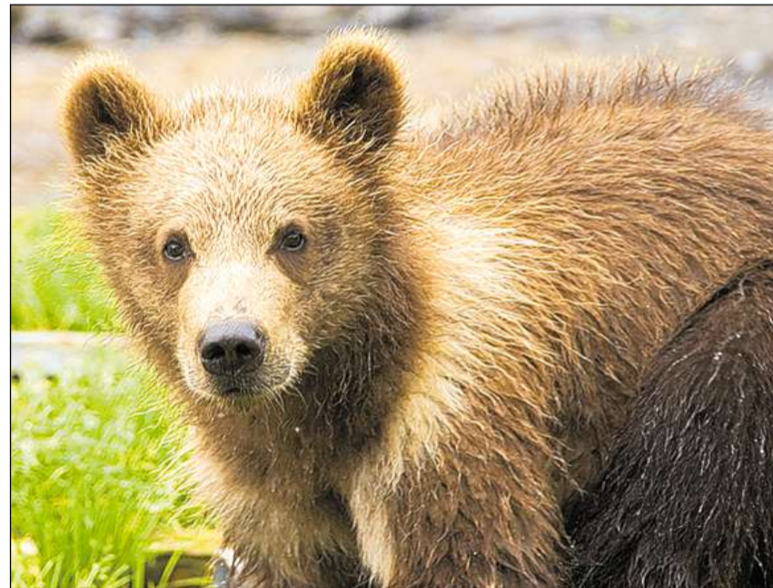
Il culier cler è tipic per animals giuvens.

Ordaifer il temp da chalur (matg fin zercladur) vivan ils urs brins solitariamain en territoris da percurs fixs ch'els pon dentant era bandunar da temp en temp. Ils