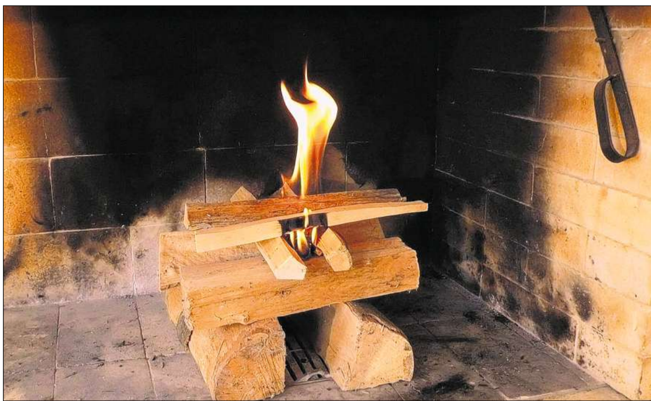
Uschia vegni fatg: piazzar il modul d'envidar sur la laina dad arder.