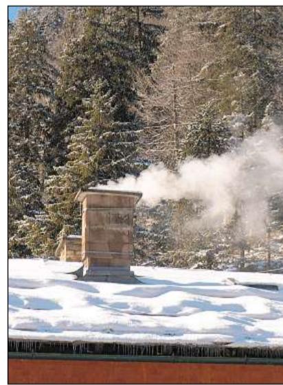
Stgaudar cun laina – in bun sentiment sch'ins resguarda tschertas mesiras da prevenziun.

Igl è simpel e favuraivel da dismetter correctamain la tschendra. E tuttina vegn la tschendra savens deponida en ina sadella da plastic sin in palantschieu da lain, en ina stegatla da chartun sin il balcon u simplamain derschida en in satg da rument. In tal agir po avair consequenzas finanzialas gravantas per ils responsabls: L'Assicuranza