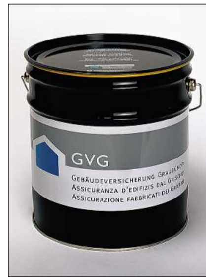
La sadella da tschendra gida ad evitar incendis.