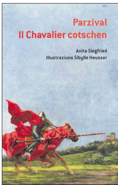
Cuverta dal carnet OSL.

Il cumià: Ma gia suenter intginas dis cumpara Clâmidè cun si'armada. Suen-