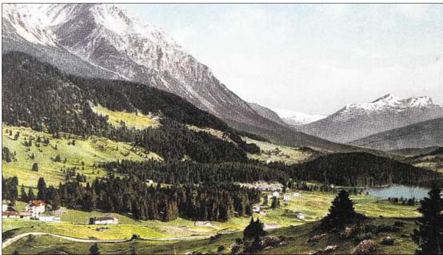
Valbella en direziun Lai (enturn il 1900).

Il 1882 è vegni avert l'emprim Hotel Kurhaus a Lai/Valbella. Il manaschi da cura era limità a l'entschatta a la stagion da stad. Insaquantas famiglias da purs èn allura sa decididas d'abitar durant l'entir onn a Lai/Valbella. Gia il 1886 è vegnida erigida l'emprima baselgia catolica a Lai/Valbella. Il 1903–04 ha inizià il traffic d'enviern a Lai/Valbella, ed il 1906 è vegnida construida l'emprima chasa da scola. Il 1914 possedeveva Lai/Valbella sis hotels, ed en ils onns 1920–40 èn suadads ulteriurs hotels e chasas da vacanzas. Il 1936 han ins costruì la funiculara Val Sporz (schlieusas tratgas da sughets) ed il 1941–42 ils runals Tgantieni e Scalottas. Dapi il 1950 regna ina gronda activitad en il sectur da construcziun da chasas da vacanzas ch'ha fatg da Lai/Valbella in'abitadi sparpaglià. L'emprim plan da zonas datescha dal 1981. Cun la construcziun da las pendicularas dal Rothorn (1963) è era vegnida averta la vart da l'ost da la val al turissem. Construcziun – sin iniziativa da la vischnanca – dals implants da sport Danis SA da la vart dal vest 1972 (fusiun da la Rothornbahn & Scalottas AG e da la Bergbahnen Danis Strätz AG a la Lenzerheide Bergbahnen AG 2005). Il 2007/08