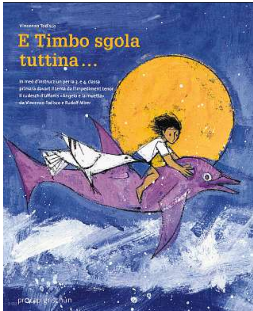
Cuverta dal med didactic, cumparì il 2010.