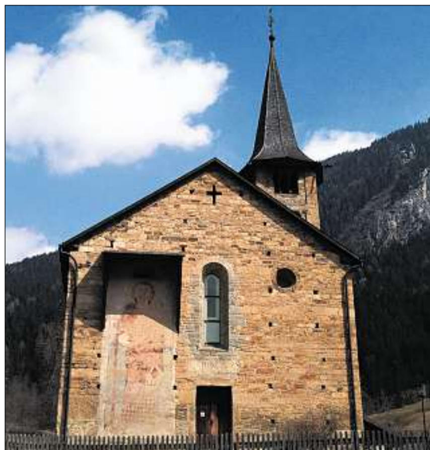
Vista exteriura da la baselgia da S. Martin.

Dapli infurmaziuns: chatta.ch/?hiid=212 www.chatta.ch