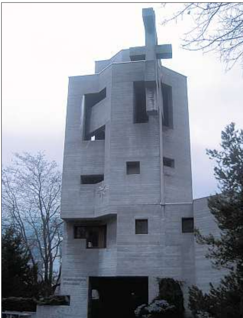
Baselgia da la S. Crusch a Cuira (1969).