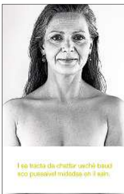
Chattar midadas: La mammografia po chattar tumors cun in diameter da cleramain sut 1 cm, quai che na fiss betg pussaivel cun palpar.

En instituts certifitgads da radiografia vegnan lura fatgas las radiografias d'assistents spezialisadas e d'assistents spezialisads da la radiografia. La controlla dura circa 20 fin 30 minutas. Quest mument n'ha betg lieu ina consultaziun da la media u dal medi. Suent vegnan las radiografias dal sain giuditgadas da duas radiologas u radiologs ch'èn qualifitgads spezialmain, e quai