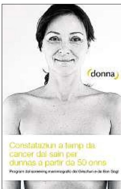
Frontispizi da la brochura «donna – program da screening mammografic» (2011).

En programs da screening mammografic vegn dada in'attenziun maximala a la qualitat. Las persunas spezialisadas absolvan ina scolaziun supplementara e las radiografias vegnan adina giuditgadas da duas medias u medis independentamain in da l'auter. La mammografia en il rom d'in program organisà cun qualitat controllada sco «donna» è ina prestaziun obligatorica da l'assicuranza fundamentala ch'è libra