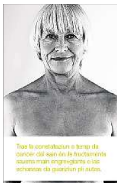
Constataziun a temp: in tractament tempriv è main engrevgiant ed auza las schanzas da guarizium.

Las controllas specificas per il scleriment d'in suspect conferman a las bleras dunnas ch'ellas n'èn betg pertutgadas da cancer dal sain. Questas dunnas survegnan ils resultats entaifer tschintg dis da lavur e vegnan suenter dus onns envidadas da nov a la participaziun da «donna». Tar circa 1% da las participantas vegn diagnosticat in cancer dal sain. A las dunnas pertutgadas vegn purschì in discurs persunal cun ina media spezialista u cun in medi spezialist da lur tscherna. Tar quel vegnan discutadas cuminaivlamain la diagnosa sco er las raccomandaziuns individualas da terapia. Ultra da quai vegn purschì in accompagnament psicosocial da la Lia cunter il cancer.