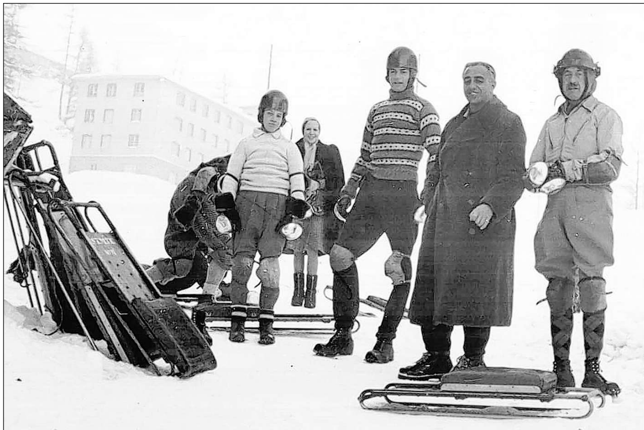
A la partenza sa concentratescha mintgin per sazez sin ses percurs.