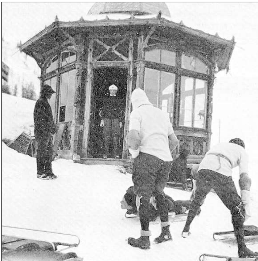
Il pavigliun da partenza dal Cresta Run sisum al Top Hut (erigi l'emprima giada il 1894).