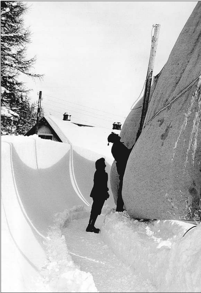
Spezialists da la Valtellina construeschan e mantegnan il Cresta Run.