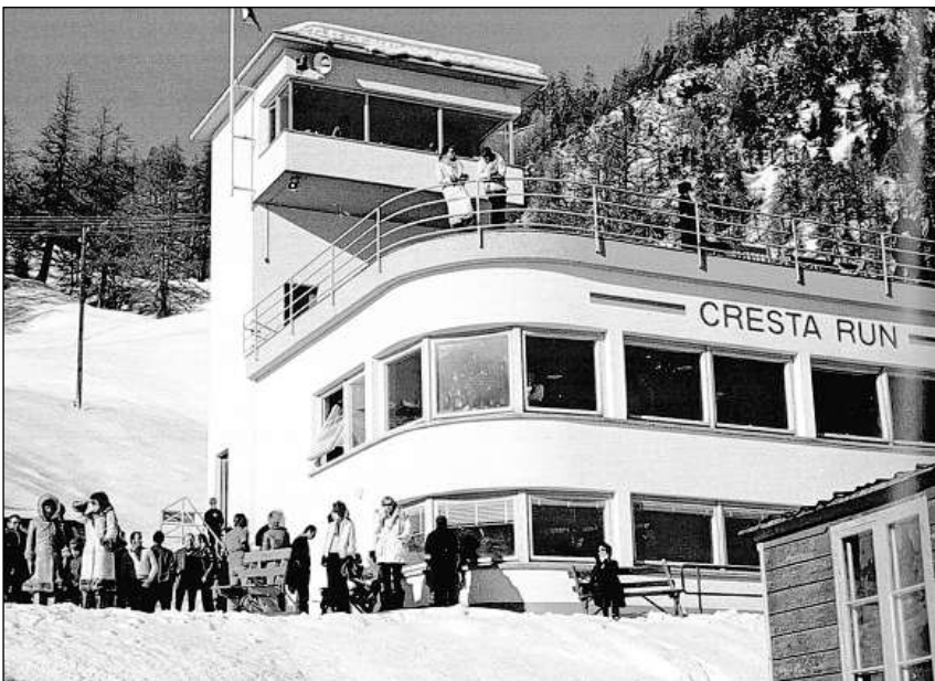
La chasa dal club Cresta a la partenza dal percurs in pau scursani (Junction), erigida il 1962.