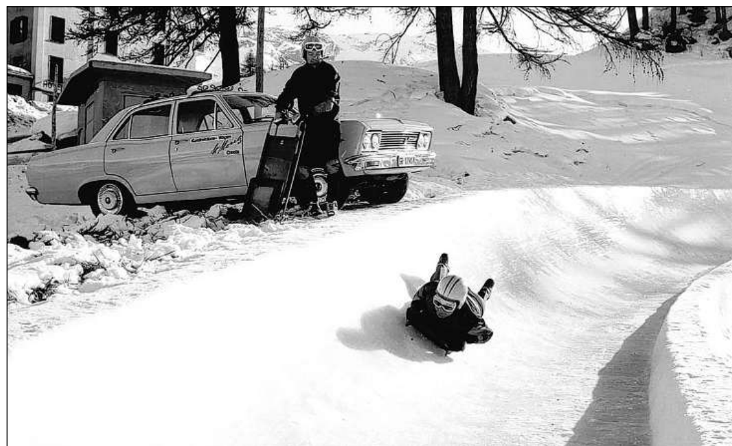
Filar cun 135 km/h e cun il chau ordavant tras il stretg chanal da glatsch – spir adrenalina.

«Il Cresta Run a San Murezzan è mintg'onn la segund gronda sculptura da glatsch dal mund.»