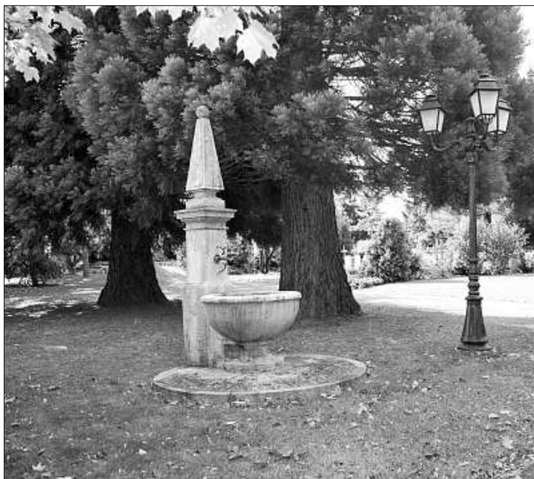
Funtauna en onur da Johann Ulrich Ochsenbein.