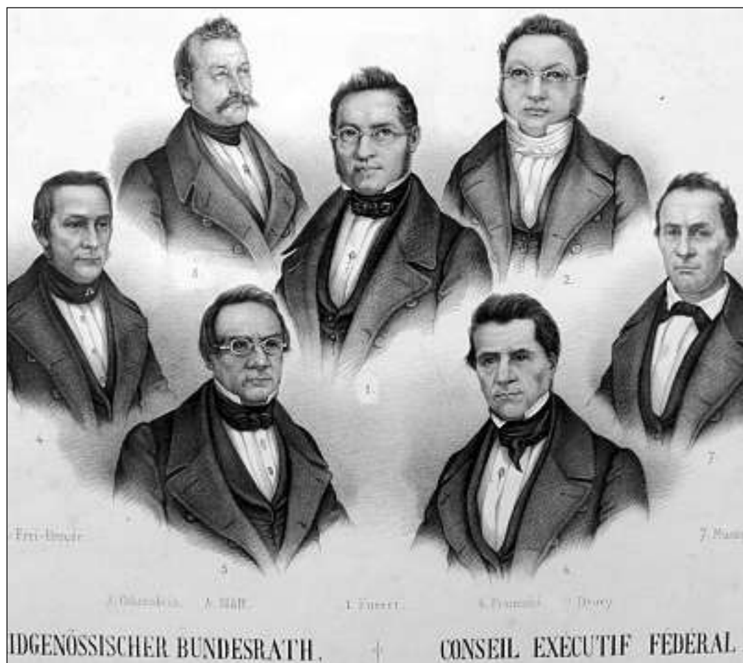
Cussegl federal l'onni 1848: Sisur sanester Johann Ulrich Ochsenbein.

Suenter sia carriera politica e militara sa retira Ochsenbein sin ses bain a Nidau e sa deditgescha a l'agricultura ed al scrire. El mora ils 3 da november 1890 en la vegliadetgna da bunamain 79 onns.