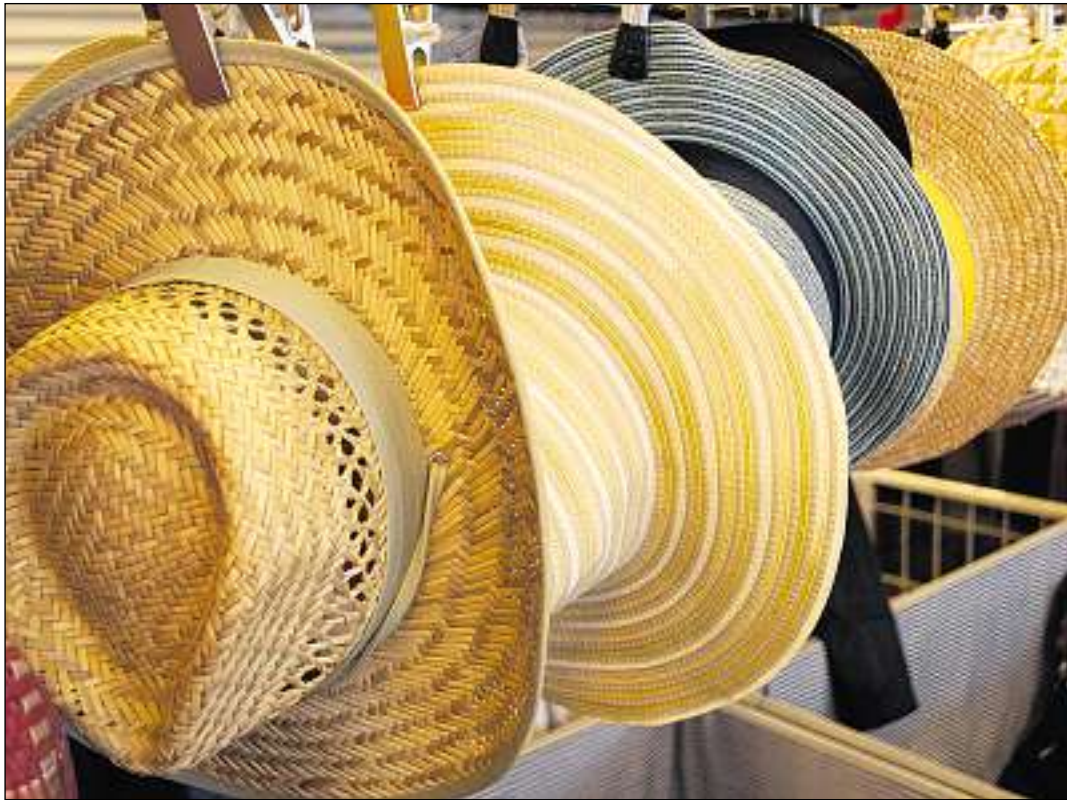
«Nua hai jau gi mes chau?» sa dumonda quel che ha pers il chapè.