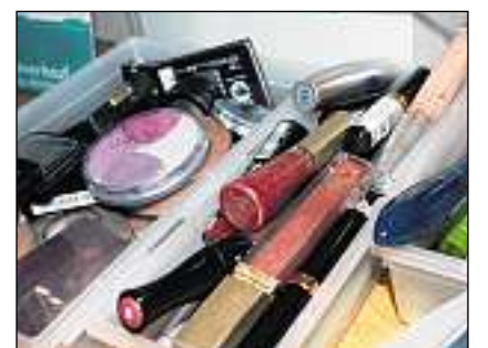
Cosmetica ord tastgas emblidadas.