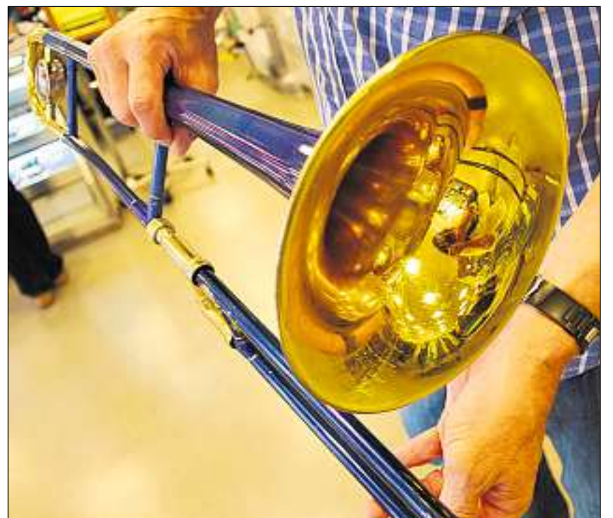
Instruments restan savens enavos en trens. «Fundsachenverkauf» po vender bain els.