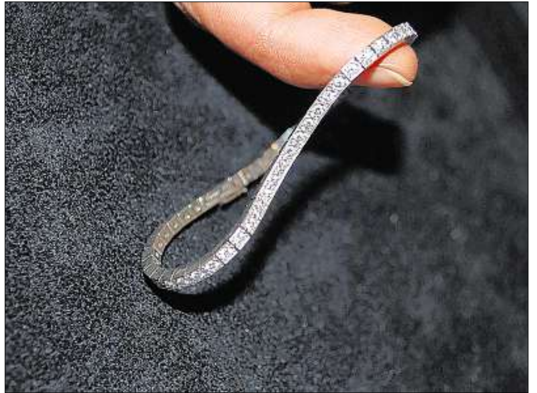
Tgi perda pomai talas custaivladads? Il bratschlet da Cartier era en ina valischa, emblidada a la piazza aviatica.