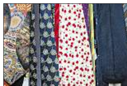
Tschertas gravattas han ins forsa pers aposta.