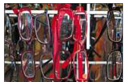
Dapli egliers ch'in opticher venda la stizun a Wollishofen.