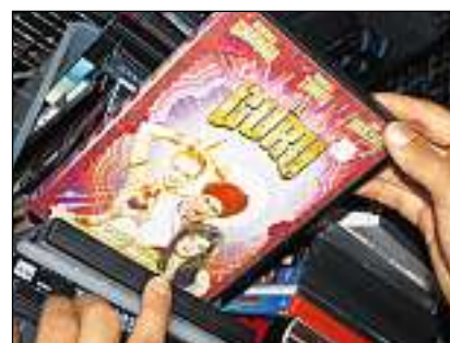
Films e portatuns per mintga gust.

Jau m'allegri gia d'era pudair observar, tge che la clientella cumpra en il «Fundsachenverkauf». Qua èsi blier pli interessant ch'en la stgaffa stgira a Trun. Ma mes temp en questa stizun cuzza mo paucas minutas. Ina dunna ma tschappa gia: «Tge bel parisol cotschen! Mo per otg francs! Quel n'emblid'jau segir mai insannua!» La dunna marscha cun mai a la cassa e paja. Ora en il liber ploi. Ils daguts fan sguzias sin mia taila. Speranza ploi anc ditg – betg che mia nova patruna m'emblidia era anc insannua.