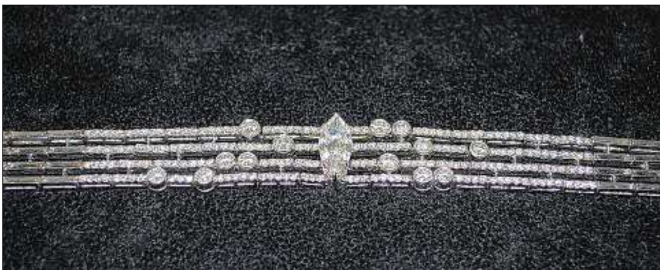
Per 17 000 francs venda «Fundsachenverkauf» il bratschlet cun la navetta da diamant e tschients brigliantins. Il juvelier schazegia la valur dal bratschlet nov sin 26 000 francs.