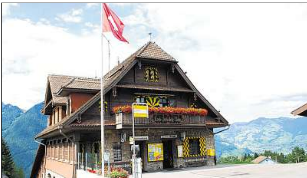
La staziun da la denticulara si Seelisberg.