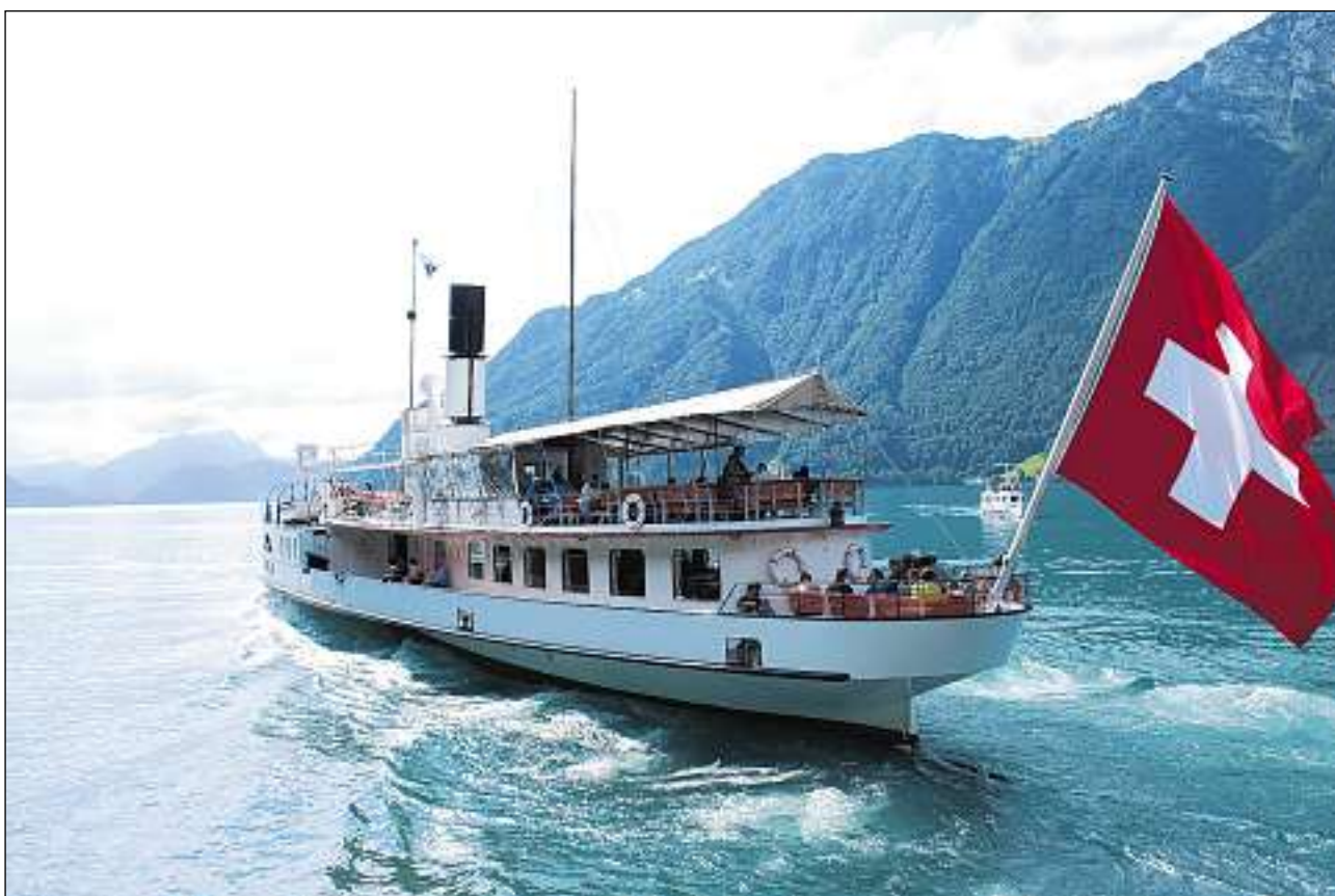
Viadi cun il bastiment sin il Lai dals quatter chantuns.