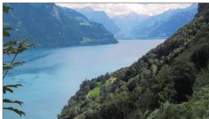
Vista giu sin il Rütli e vers Altdorf a la fin dal lai.