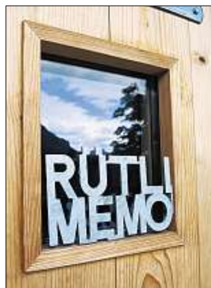
Davos questa fanestra sa chatta il pitschen museum.