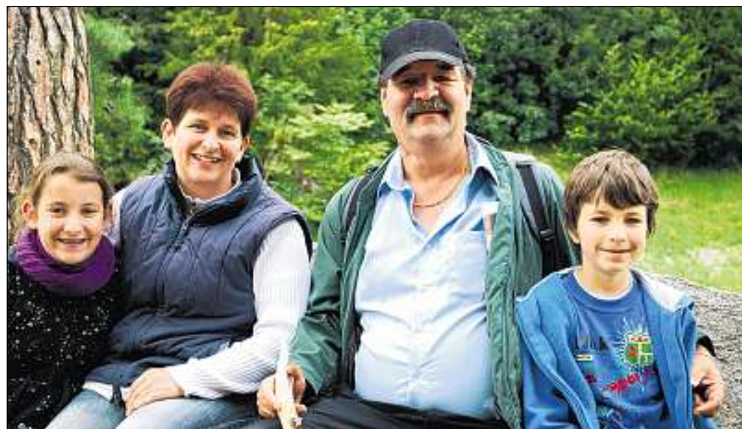
La famiglia Mahler dal chantun Son Gagl sin il plaz d'engirament.