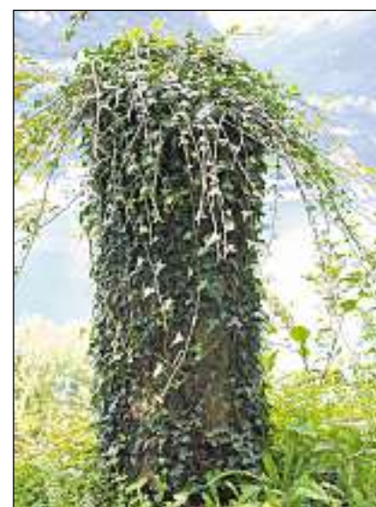
In schani spelà a l'ur da la senda vers Seelisberg.