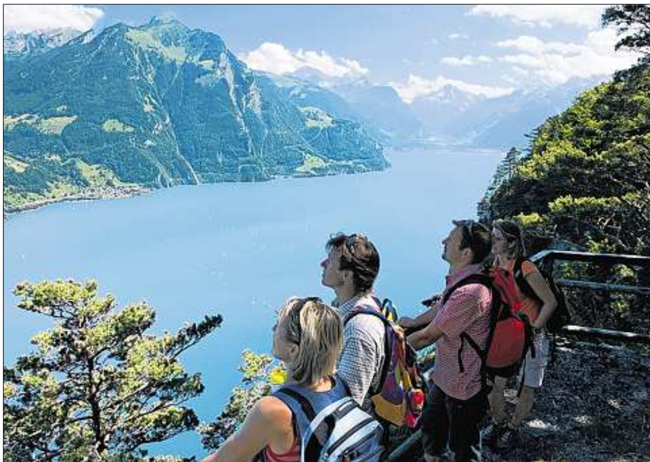
En viadi sin la Via Svizra. Sguard en direziun da Sisikon, davosvart Flüelen.

Bauen – Isleten – Seedorf – Flüelen: Sin la via tranter il lai ed il grip da l'Oberbauenstock spassegiain nus en direziun sid, tras galarias da grip dals onns tschuncanta. Nus arrivain ad Isleten (fabrica da di-