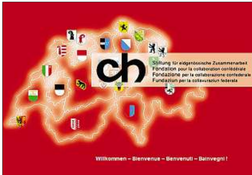
La Fundaziun ch gestescha il program «Emprima Piazza» sin mandat dal SECO.

ins tegnair endament ils suandants puncts: esser punctual; far ina buna parita – sa vestgir da maniera correcta; notar oravant tge dumondas ch'ins vul far a l'inter-