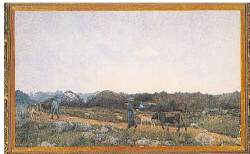
«La natira» (Tripticon II), l'ultima obra da l'artist (1897-1899).